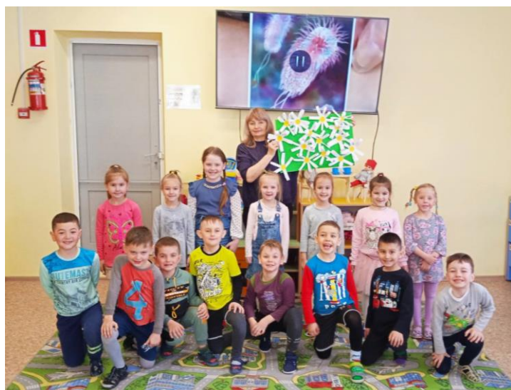
Конструирование из бумаги «Белая ромашка - символ чистого воздуха»