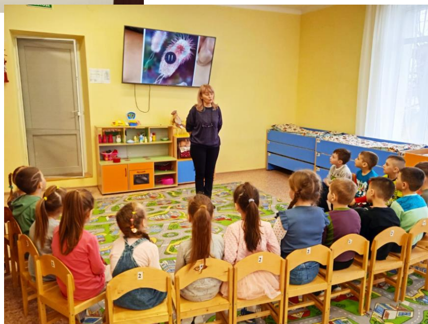
Просмотр видеоролика «Где живет туберкулез»