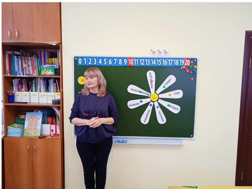
Беседа «Как сберечь своё здоровье».