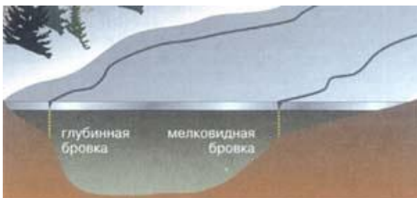
Рис.2. Образование первичных трещин в местах стыковки льда с различной толщиной.

Однако хаотичность трещин на поверхности льда только кажущаяся, если помнить о механизме льдообразования: прежде всего в начале зимы, когда лед еще не везде одинаков по толщине, напряжения проявляются по границам стыковки толстого и тонкого ледового покрова, то есть там, где мелководье резко переходит в глубину. При этом глубокая сторона водоема будет определяться по близко располагающейся к обычно крутому берегу трещине, и наоборот.