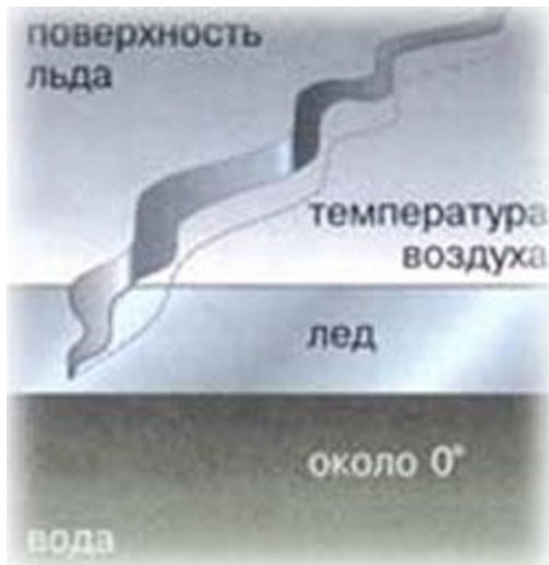
Рис.1. Разлом на поверхности льда, вызванный его температурной деформацией.

понижением его температуры, однако температура льда по толщине различна: сверху она равна атмосферной, а внизу – соответствует точке заморзания воды, то есть около 0^{\circ} . А поскольку температурный коэффициент линейного расширения льда огромен (например, в пять раз больше, чем у железа) и всем известно, как разрываются прочные сосуды с замерзшей водой, то становится понятно, что аналогичные процессы сопровождают ледяной покров по мере роста его толщины: имеющие разную температуру слои испытывают расширяющие нагрузки как поперечного, так и продольного направления. Именно поэтому при значительных морозах лед лопается с оглушительным, "пушечным" грохотом, и по нему разбегаются длинные трещины, имеющие замысловатую форму (рис.1).