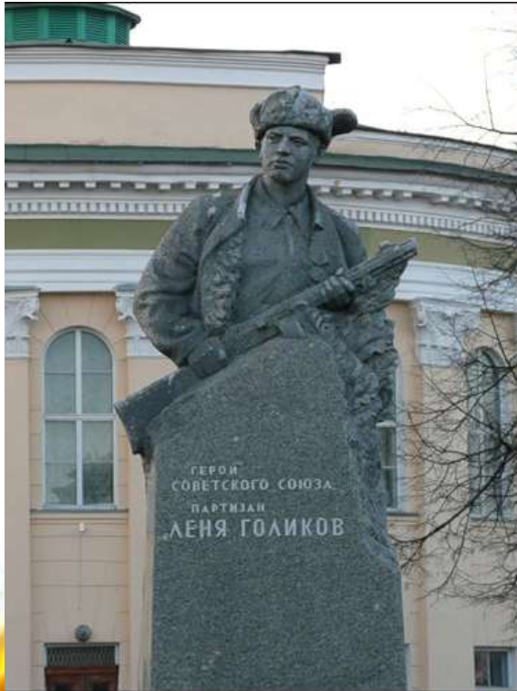
Памятник Лёне Голикову в Великом Новгороде