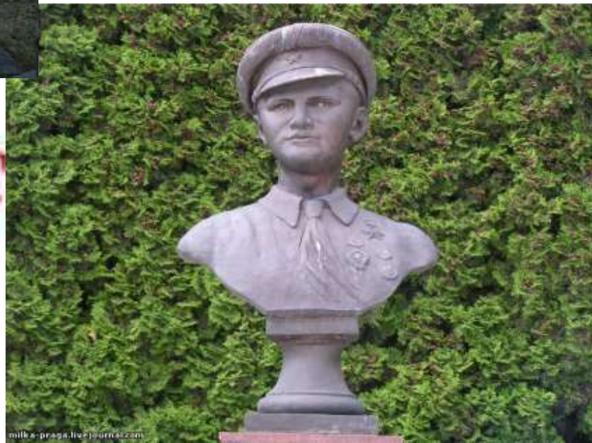
Памятник на ВВЦ