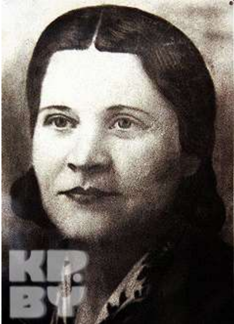
Мать М. Казея