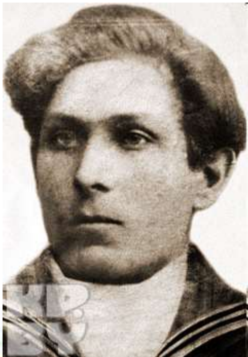
Отец М. Казея