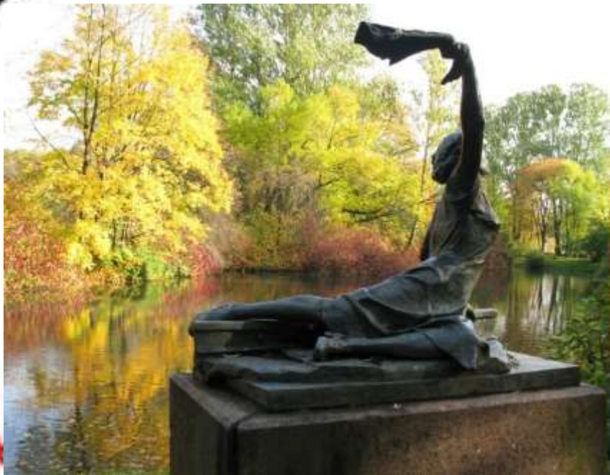
Памятник З. Портновой в Витебске