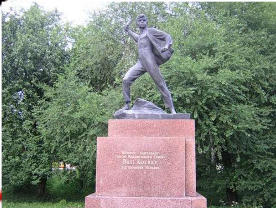
Памятник Вале Котику в Шепетовке