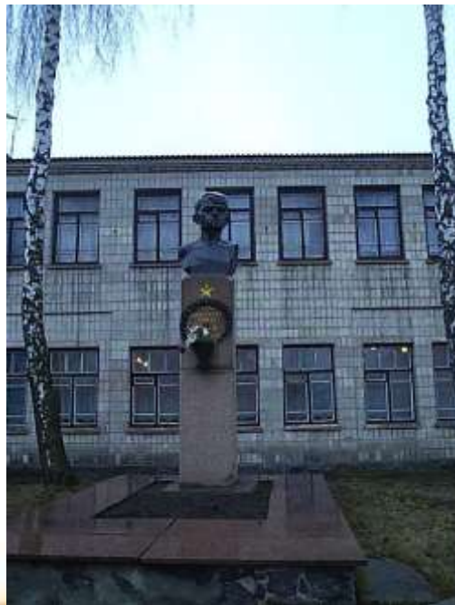
Улица В. Котика в Шепетовке