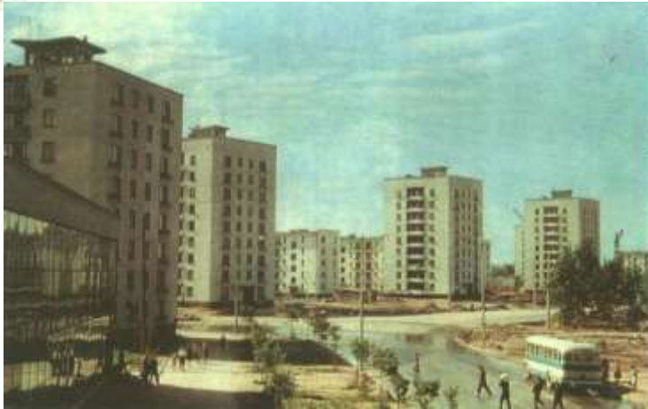
Улица Зины Портновой в Санкт - Петербурге