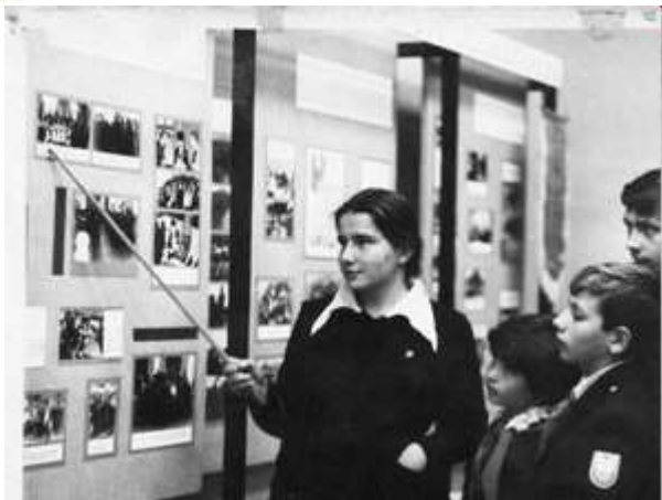
Музей В. Дубинина в школе № 1 г. Керчи