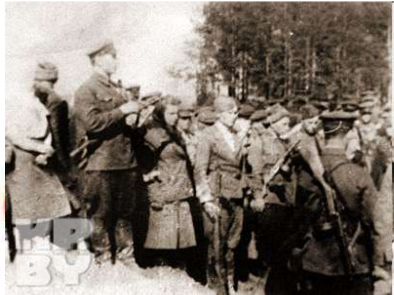
Похороны М. Казея в деревне Хоромецкие