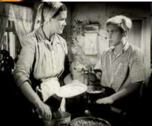
Кадр из фильма «Орлёнок»