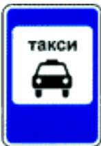
«Место стоянки легковых такси».