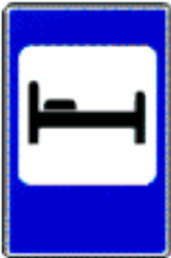
«Гостиница или мотель».