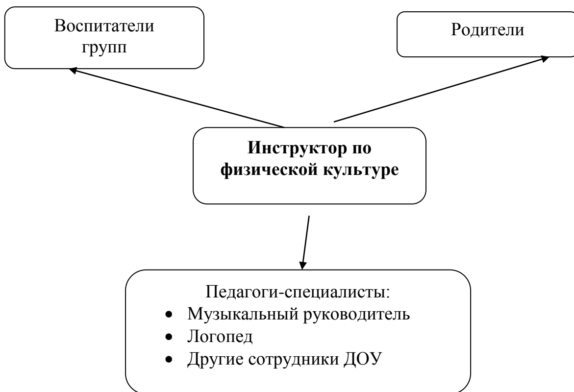
Схема организации работы по взаимодействию с другими участниками образовательного процесса