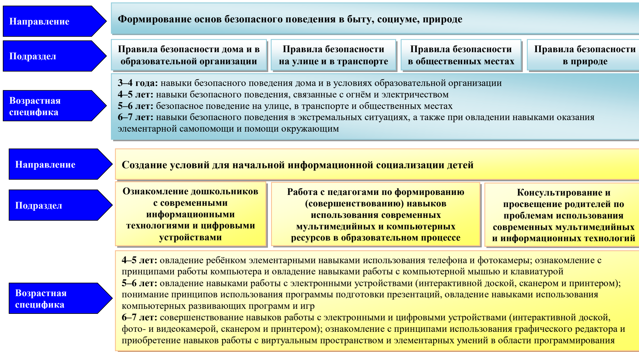
Рисунок 2. Преимущество в содержании педагогической работы по направлениям социально-коммуникативного развития детей