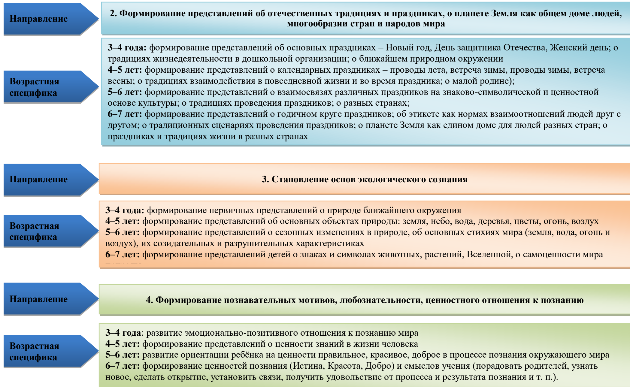
Рисунок 8. Преемственность психолого-педагогической работы по познавательному развитию детей