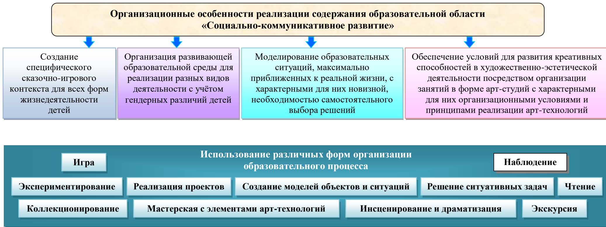
Рисунок 3. Организационные особенности реализации содержания образовательной области «Социально-коммуникативное развитие»