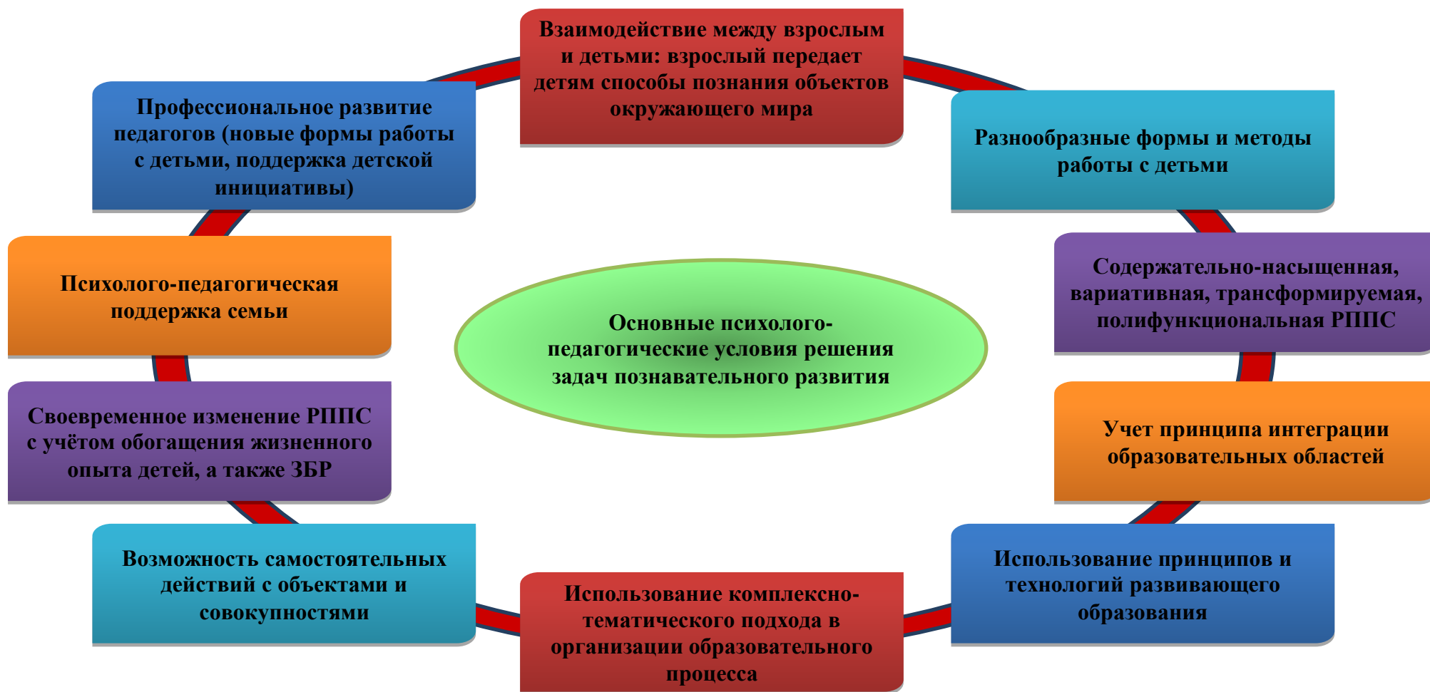
Рисунок 6. Основные психолого-педагогические условия решения задач познавательного развития детей дошкольного возраста