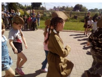
Военно-патриотическая игра «Зарница»