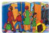
В ОБЩЕСТВЕННЫХ МЕСТАХ