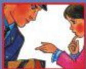
НА УЛИЦЕ ИЛИ В МЕТРО- ПОЛИЦЕЙСКОМУ