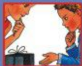
В МАГАЗИНЕ- ПРОДАВЦУ