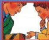
В ТРАНСПОРТЕ- ВОДИТЕЛЮ