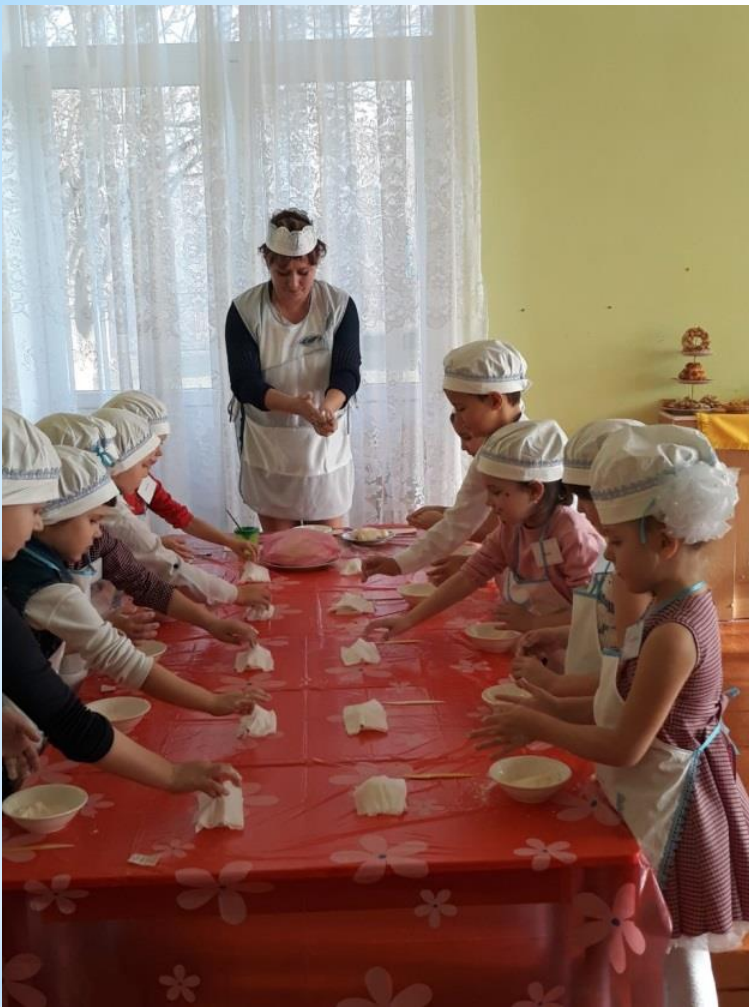
* Мастерские «Мукасолка»