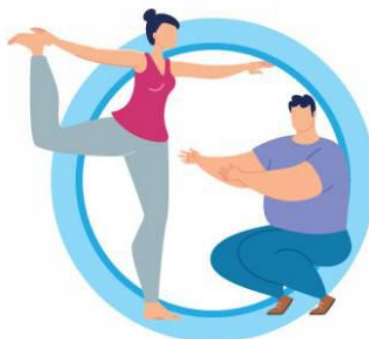
ВЕДИТЕ ЗДОРОВЬИЙ ОБРАЗ ЖИЗНИ