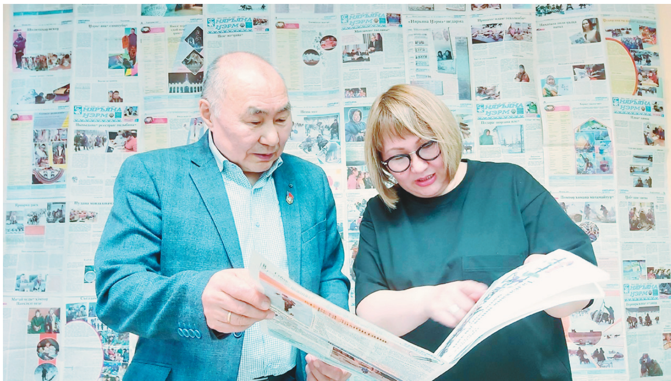
«Няръяна Нэрм» редакцияханана” Кузьма Николаевич сава мядондава”. Нармы ниде няцэ минреванде серодо’ хахакуд нобкана тасламбангудо’. Маня” юнедо’ нерденаңэ нядандо’ намдортына”.

Үока по” тяхана округханана” нэрм’ тер нядабава’ е”эмня «Ямал-ню”на” я!» Ассоциациям’ сертацэ. Минрена манзаядо’ тодо ян’ тятро”на. Поңганандо’ нармы” ненэцие” Советодо’ нани’ тания. Тикы’ нямна хэвы си”ив яляхана юнм’ намдавацэ.