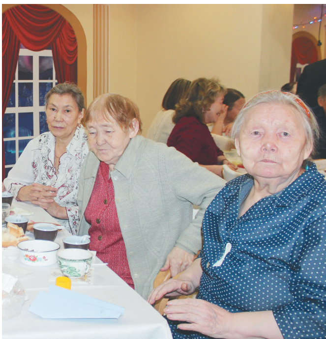
Теда’ нармы ненэцие” Советхана пиванда манзаяда үока нэңгу. Серм’ теневаб”, нянанда нарка тоенанада яңгода.

Харта нод” иланда ямбан’ техэ яхананда Хальмер” Седе’ няна палытанаңэ тарасэ. Юкад вата си”ив по’ ямбан’ пыда ила’ ватом’ мадавы”, хадкэпявы” серо тидхалембисэ. Үока серм’ техэ паңгханда тэврамбидасэ. Нылана хэ”мяхаданда факторияхана манзарасэ.