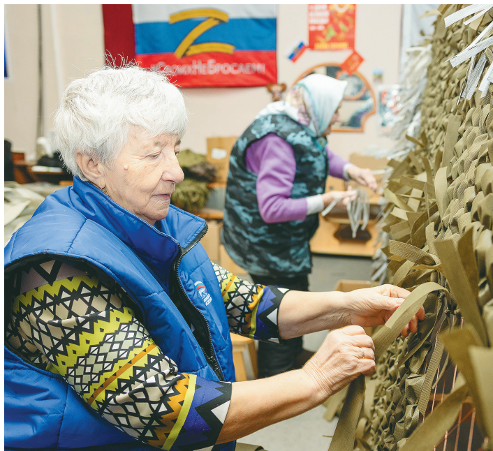
За прошлый год волонтеры отработали более 200 запросов ямальских военнослужащих.

– Мы постоянно ищем информацию о том, что ещё можно сделать, и, естественно, опира-