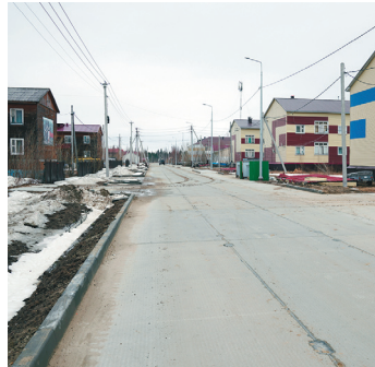
Протяженность автомобильных дорог с твердым покрытием по всему району составляет всего 25 километров, общая – 59,1 километра.

Наземная связь между селами в холодное время года держится на зимниках. В остальное время добраться можно только по воздуху – вертолетами и небольшими самолетами, субсидируемыми из бюджета. Уровень комфорта пока слабоват: в Ратте нет дорог с твердым покрытием, мобильная связь в Тольке и Ратте работает в стандар-