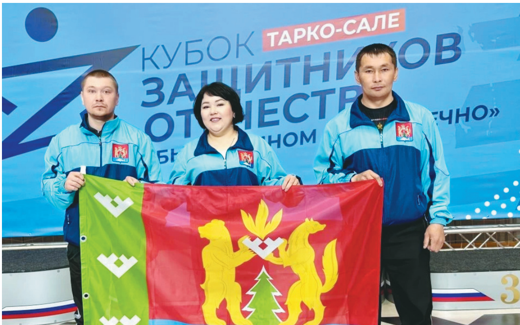
Не спортсмены, но победители: толькинцы доказали, что характер бывает важнее разрядов.

Каждый спортсмен мог заявиться на участие в двух видах соревнований. Оба наших участ-