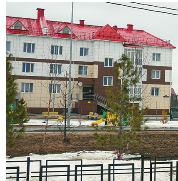
Аварийный жилищный фонд составляет 15 процентов от общего объема – почти каждый седьмой квадратный метр жилья признан непригодным для проживания.

Территориальная отдаленность практически не сказывается на культурной активности. Только за первый квартал 2026 года клубная система провела 332 мероприятия, охватив почти 48 тысяч человек. Это означает, что каждый житель посетил в среднем восемь культурных событий. В районе работают две детские школы искусств (290 учеников, 18 образовательных программ), краеведческий музей с