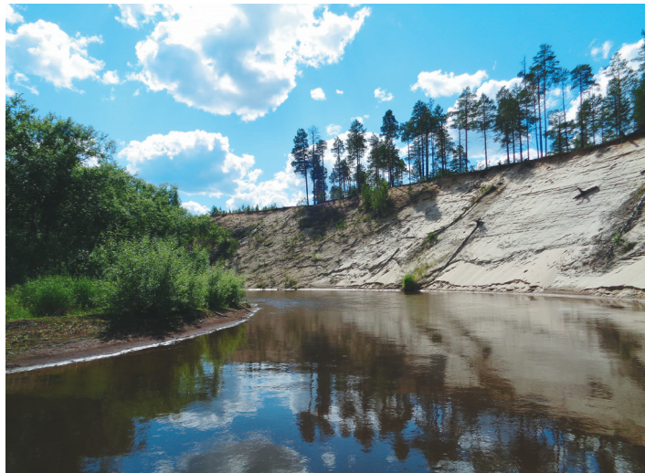
В бассейне реки Поколька расположены уникальные природные и этнолокальные ландшафты коренных малочисленных народов Севера – селькупов, а также древние археологические памятники.

Река Поколька – западная граница заповедника. Это также левобережный приток Таза длиной 260 километров и площадью водосбора более 3710 квадратных километров. Физико-географическое и природно-климатическое описание Покольки во многом схоже с Раттой. С 1989 года река перекрыта крупным завалом в нижнем течении, а также несколькими временными завалами в верхнем течении,