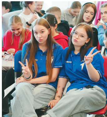
Дети и молодежь в селах могут развивать свои таланты наравне со сверстниками из городов.

В школах района 114 детей изучают родной селькупский язык, в юбилейном диктанте на языках коренных народов Севера участвовал 41 житель. Четыре семейно-родовые общины занимаются традиционным рыболовством –