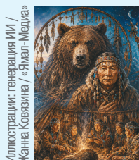
Иллюстрации: генерация ИИ / Жанна Ковязина / «Ямал-Медиа»