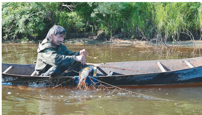
Многие реки являются промысловыми, в них водится ценная деликатесная рыба. Мужчина на лодке-ветке (обласке) проверяет сети на реке Каральке.

Гидронимы Красноселькупского района отражают животный мир: Канак-кикя «Ручей собаки», Лоҕат-корыль-кикя «Лисы (лисий) глубокий ручей», Тотыль-кы «Выдры речка», Саҕы-сий-кы «Черного соболя речка», Өталь-то «Олень озеро», Паҕыль-кы «Лосиная речка», Паҕыль-ту «Лосиное озеро», Җормый-кикя «Быков-самцов ручей».