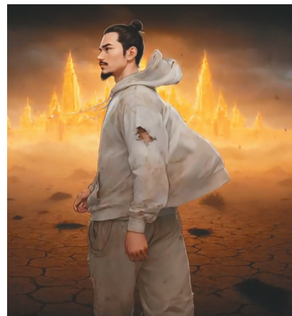
Скриншот видео «MoopAmi – Песнь путника»