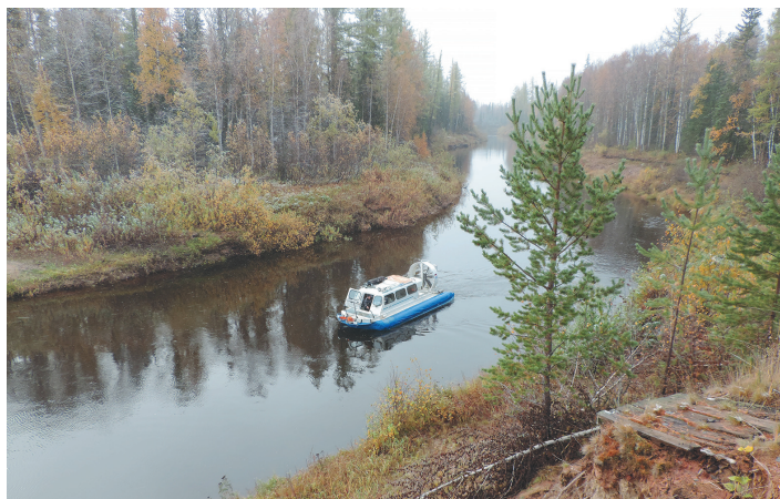
Река Ратта – одна из крупных в районе. Ее глубина позволяет осуществлять пассажирские перевозки.