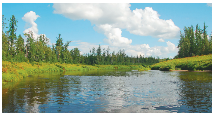
Река Худосей знаменита своей кристально чистой водой, древним Мангазейским волоком и уникальными историческими памятниками. По ее берегам до сих пор можно встретить старинные «затеси» – зарубки на деревьях, сделанные исследователями и купцами.

Среди названий встречаются связанные с птицами: Җараль-кы «Журавлиная речка», Пияль-кы «Совиная речка», Сәңкыль-кикя «Глухариный ручей», Щипаль-кы «Утиная речка». Наводкой для рыбаков были гидронимы Ныршай-кикя «Ершовый ручей», Җосаль-кы «Окуневая речка»,