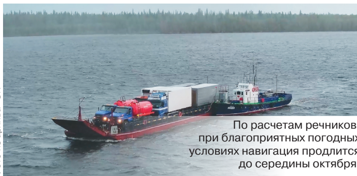
По расчетам речников, при благоприятных погодных условиях навигация продлится до середины октября.