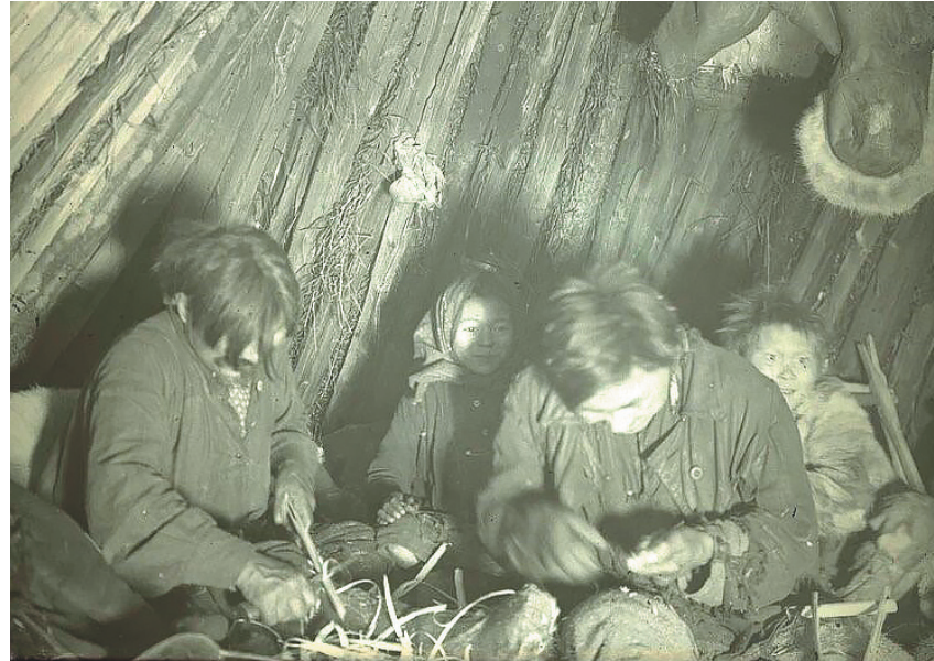
Фото: Г. Н. Прокофьев, 1925–1928. МАЭ И 1177–53.

А с февраля начиналась «большая ходьба», или «большая дорога». Охотники уходили за белкой за сотни верст от мест кочевания. Интересная деталь: у каждого охотника было два «своих места». Одно – речка или озеро, где семья проводила весну, лето, осень и половину зимы. А второе – район промысла, куда