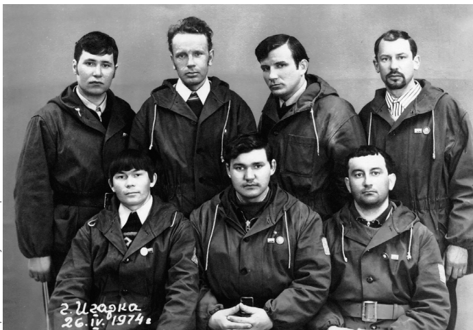
Участники первого агитационного перехода, посвященного XVII съезду ВЛКСМ, по маршруту Красноселькуп – Игарка 1974 года.