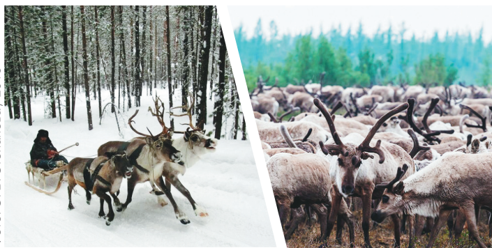
Фото: О. Б. Степанова / 2016

Тап шенты челоқын өтәп орқылпытый ұры үррән-тырорынья. Советскай коллективизация, мәрқы өтәй стадан, қумытын мызын снегоходан, мәнпар нутшүнчы ныны мачын өтән чумы тальчый сурытыса – на муқылтырый кризисқа әңа. Государства пәлтымбаты, шенты өтәм орқылпытый ұрым, шойқумын өтәтым мәрөтын на тәпытын ылыптә, тәнаптымпөтын меқынныт муғтырты чөты ай иттырқа илын-тый нутшүнчыым.