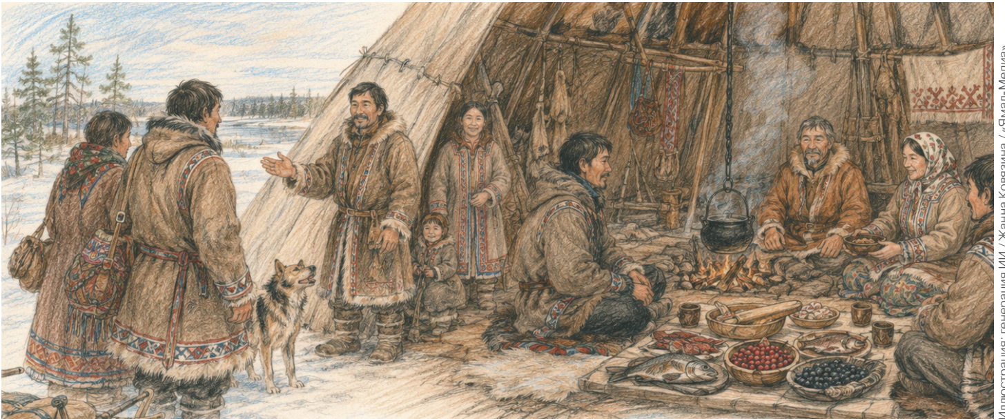
Иллюстрация: генерация ИИ / Жанна Ковязина / «Ямал-Медиа»

Мэттанты сомак этып кэтыкөйпысөтын, өимпөтын тымты чөтықа, эттыла ты ай түңылын.