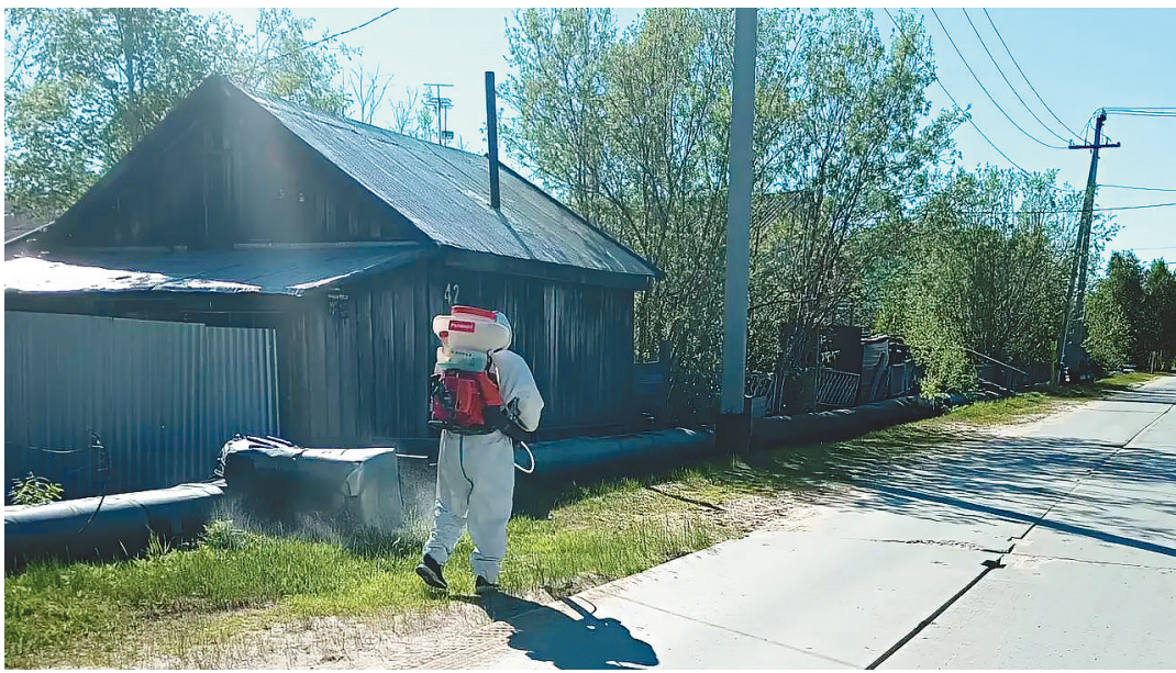
Никакой самодеятельности: у подрядчика есть лицензия на дезинсекцию.

– Мы обрабатываем весь жилой фонд, придомовые территории, а