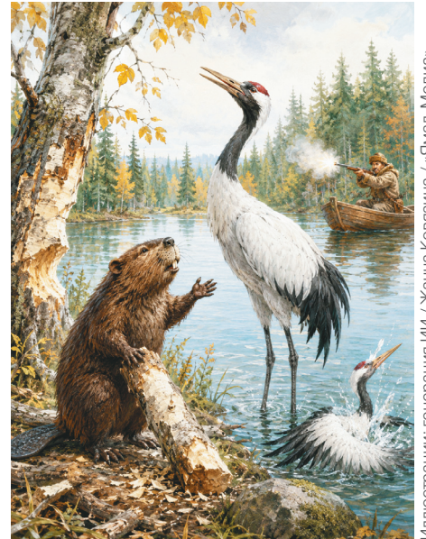
Иллюстрация: генерация ИИ / Жанна Ковязина / «Ялал-Медиа»