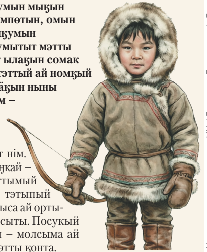
Иллюстрация: генерация ИИ / Людмила Голышева / «Ямал-Медиа»

Атылымпат, шойқумыый чәптәңын – ним ашша нытыкөтын куттар утак, тымты тотык әты әттука. Тэм пұтый ұрыты атылымпат (Итте), шитты қолты (Анка ныны Калгух). Ним на исачерый әты, куттар өнтыт қос атылтэнтөңыт, коччик чәптәңын уккыр ним әңа.