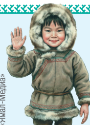
Иллюстрация: генерация ИИ / Людмила Голышева / «Ямал-Медиа»