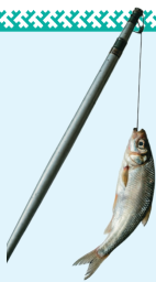
Иллюстрация: генерация ИИ / Людмила Голышева / «Ямал-Медиа»

В тушении задействованы более 450 человек и четыре вертолёта Ми-8 «Ямалспаса» с водосливными устройствами. Несмотря на колоссальные усилия, обстановка остаётся напряжённой.