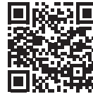
Электронная версия «Северного края»

Для оформления контракта необходимо обратиться: – в военный комиссариат города Губкинский, Пуровского и Красноселькупского районов по телефонам: +7 (34997) 2-24-09, +7 (34997) 2-56-63; – в администрацию Красноселькупского района по телефону +7 (34932) 2-14-61 по месту жительства.