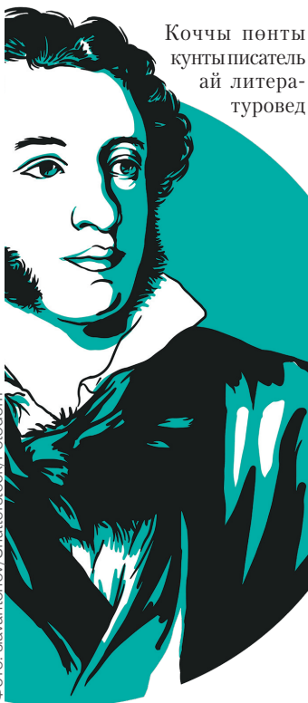
Коччы пөнты кунтыписатель ай литературовед

10 чаңай ирәңынты 1837 пөңын шитты челыт чипөңын дуэлит нэны ўрымпа қотол сома руший поэт Александр Пушкин. Тэпын эса 37 пөты, а тэп төн истап нэқырым нэқырпаты. Генияп тапчелый тэтты тэт тэнымөтын, тэпын произведениямты тоғылтмөтын.