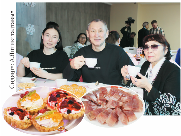
Сидяңг: А.Ялтик: тадтавы"