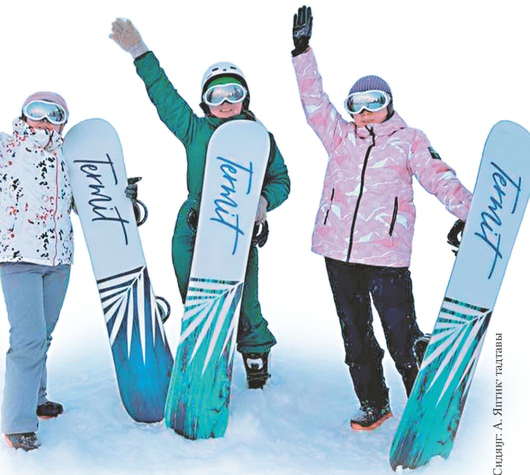
Сидяңг: А. Яптик' тадгавы

Мара" џопой нява" торомбэрка џэвы, сита хонрамбиваць, пыда сидна" табедамбись. Нерня салмуй явна хор"њаваць, пуна ядувна едейко пэйнаць. Сян мантэвава", юркавава", танабавна латна" мине ханабавана" нинась толабю", толаба пяб", жокаркаць. Хэувнана" хайна, таңга минда" хан"њаць. Маня" џод" мерцясавэй ханта" пирувна миман' харваваць, тикахад сидто' тотрев' я"маваць. Сейна" пинбато' џод" џопой