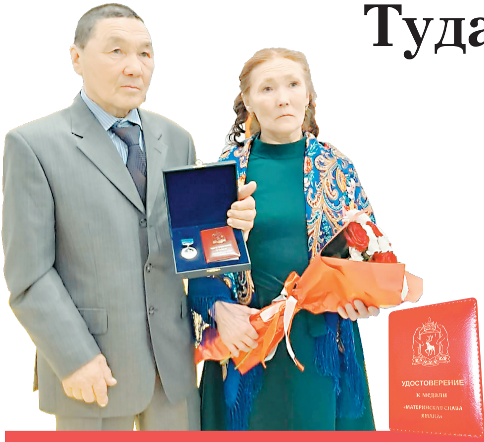
Сидяңг.: С.Тусида тавы

Ярой' коранда мюня морёхот мята ту гэри хаңабтырҕа. Сяхаринда тарця җэсеты. Иланда ямбан' сяни" по" техэ Яндо небя хадахаданда, вэсаконда небахад ня"амвы тумда тедалахана минреда. Теда' Яхоне Тонкывна Яндо' небяңэ, хадаңэ җахана хаясь.