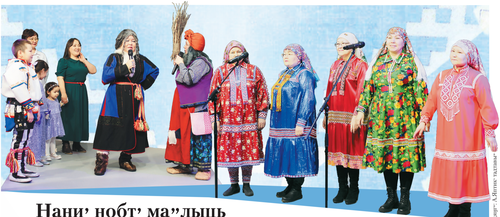
Сидяңг: А.Ялтик: тадтавы"