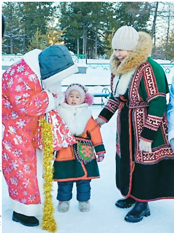
Сидяңг: В. Окоэтто' џэдабгавы

Неноховавна по' ямбан' хуркари' серка"на ва"лэйңэ џэвы" џацекры саву"њаваць. Пыдо' сававна тохолковы", пирдырмаха"на нерня' ха"мормы", мел' нито' поңгана џобтики ва"мы". Нудито' терңэ џамнялада" хамбетка" пад мипиваць. Пихина џарка"я хады' хэвхана сянакурњаць. Хыноњаць, тараць. Маня" сейхад миндя вадие"эмнандо' мэ"њаваць. Тарем' яля' няю' џэда" џацекеця" сидна" етри' нядабасеты". 2024 похона сертавэдо' жока. Хибяхавадо' – мел' сэдорана, џанидо' – сеётэй", тарана", падтаңгурта". Сэбар" поңганандо' џани' таян".