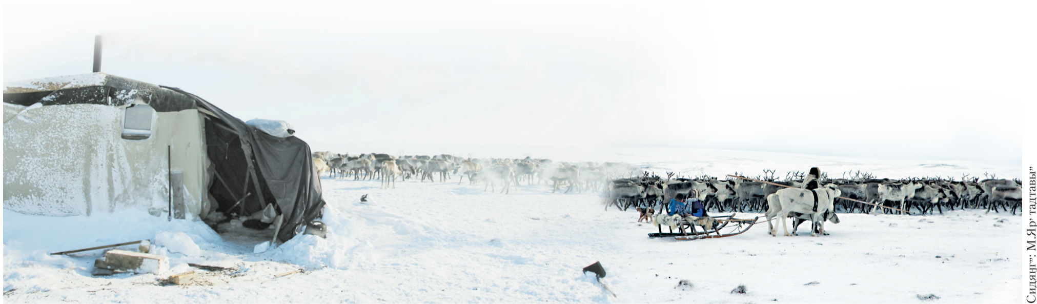
Сидяңг.: М.Яр' гадтавы