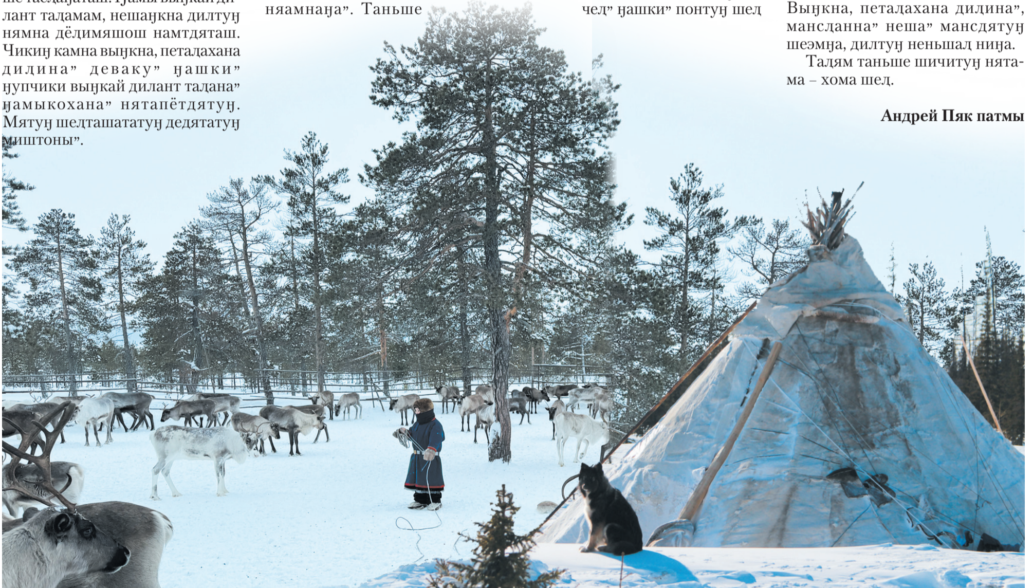
Сидџаџу Пџак таџтамы"