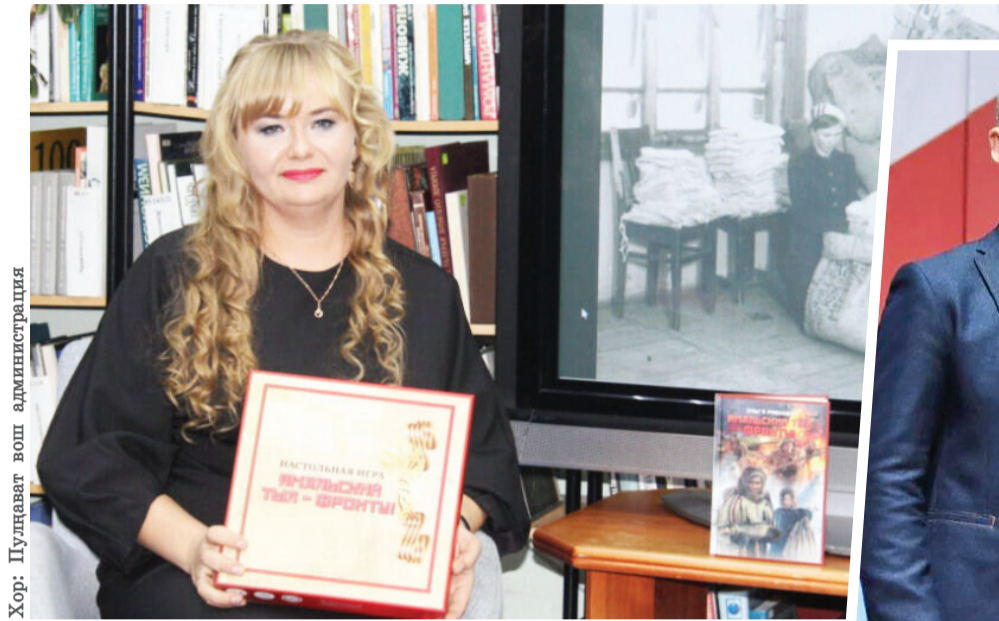
Хор: Пулцават вош администрация