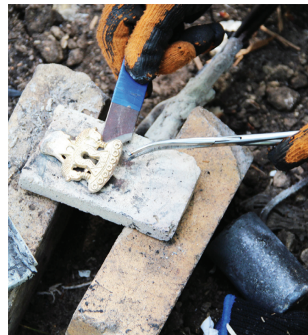
Хор: Айкоп Павел