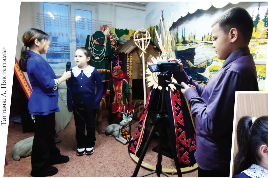
Таттама: А. Пяк таттамы”

Чуки дилихина җашки” телевидениң дет җайта дядям мәшту”. Четаң, чуки ноптухуна электронные СМИ” шанат нешаң дилант тәвдят”. Җалтана” җашки” телевидениң мансдьян тохотамаң мәты нешади” дет тондота центрхана студия видеотворчества «Синема» тадя.