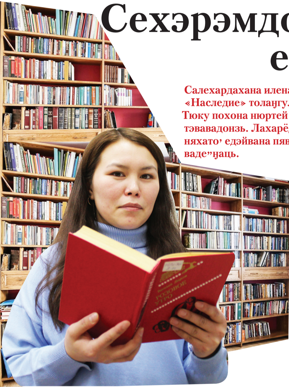
Сидяҗг: Р. Окоҗтто' тадгавы