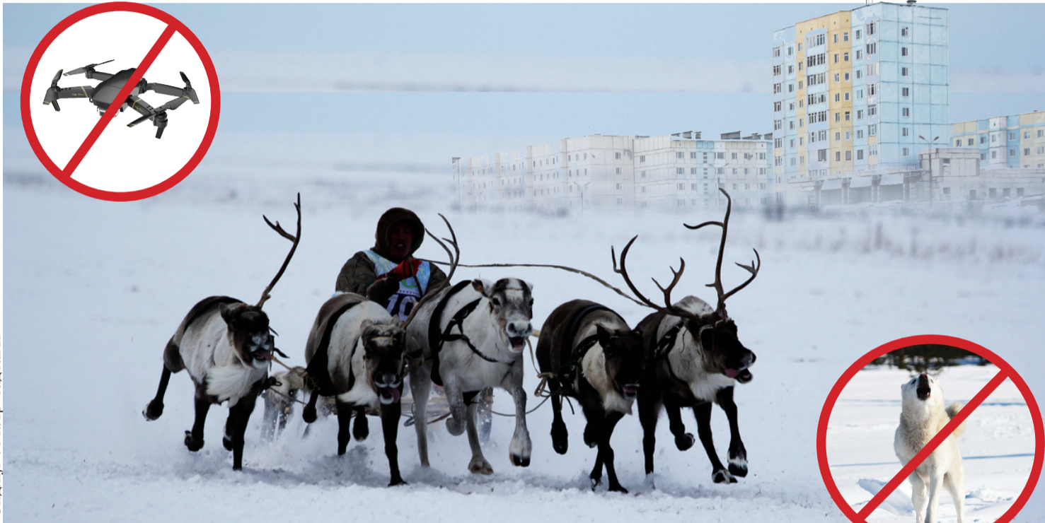
Сидяңг”: М.Яр тадтавы”