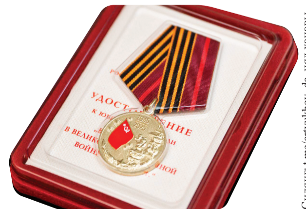
Сидяңг”: t.me/artuyukhov_da нэд ханава

тетри, Ленинградм’ нэдабавы – хасава ю”, лэгерьхана сярвы - сидя ю” тет, манзаяха”нато’ нэдаңговы” – мат” ю” сидя ненэця”. Едэй ненадумда”мам’ тарця серка”на таравы” ня”марпаңгудо’.