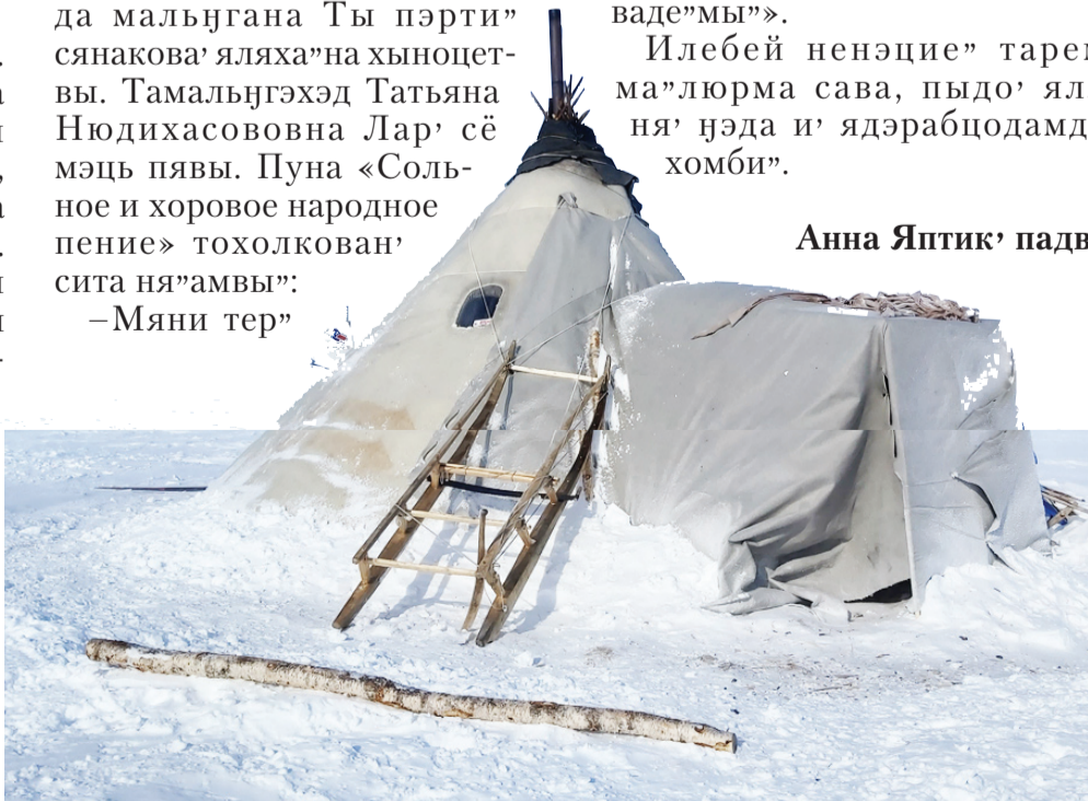
Сидяҗг: А. Яптик' тадгавы