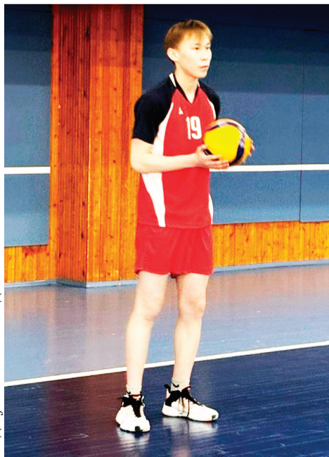
Сидяҗг: А. Яптик' тадгавы