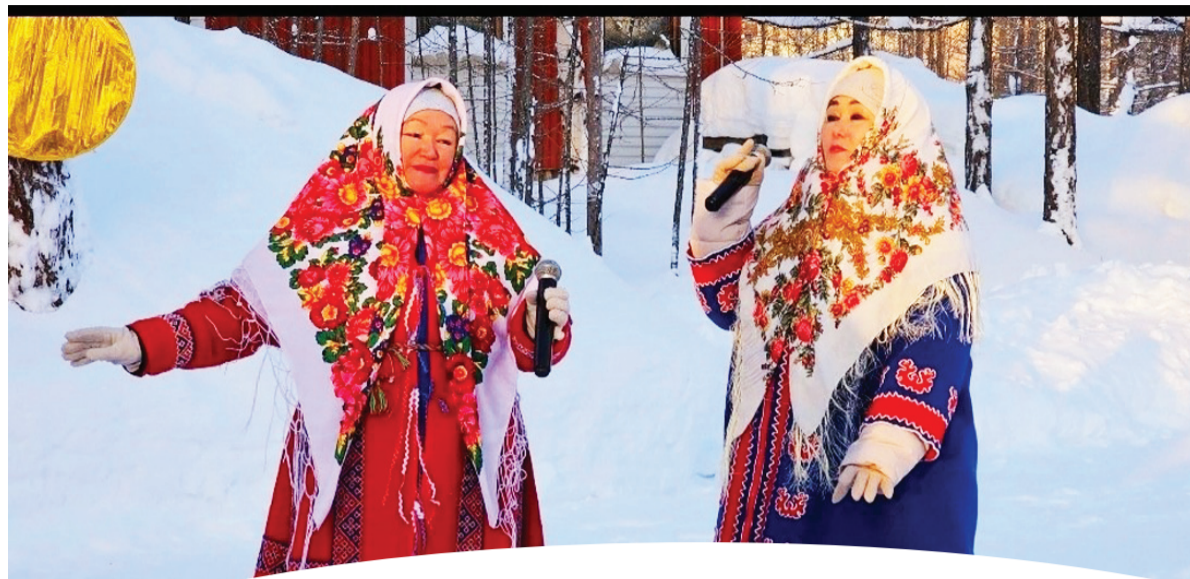
Сидянт: tsnkpadum ияд ханавы”