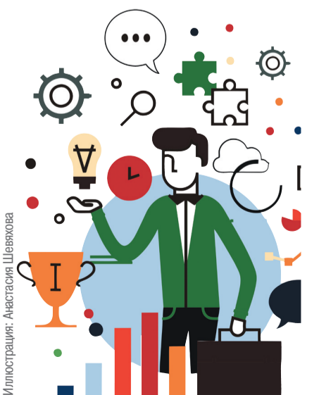
Иллюстрация: Анастасия Шевцова

Ямал отлично выступил в национальных чемпионатах профмастерства, завоевав 31 медаль. Из них 14 – в национальном чемпионате «Молодые профессионалы», восемь медалей в Чемпионате северных профессий, шесть медалей в национальном чемпионате «Абилимпикс» и две – в конкурсе «Навыки мудрых».