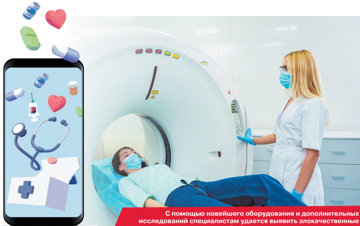
С помощью новейшего оборудования и дополнительных исследований специалистам удастся выявить злокачественные новообразования на самых ранних стадиях.