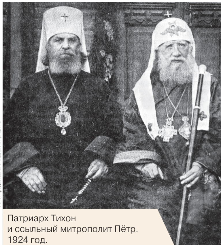
Патриарх Тихон и ссыльный митрополит Пётр. 1924 год.

– Сегодня на территории этого села существует только старинное кладбище, руины зверофермы, полуразвалившийся дом 50-х годов прошлого века и один новодел 90-х. Но при этом на территорию этого села летом 1994 года приезжал патриарх Московский и Всея Руси Алексий II. А Тобольско-Тюменский патриарх был там несколько раз. Отдавали дань памяти. В этом селе в ссылке на протяжении трех лет, с 1927 до 1930, в начале 20-х годов XX века находился местоблюститель патриаршего престола митрополит Пётр Полянский. Село Хэ в истории округа сыграло колоссальную роль. Но, более того, это село значимо в истории русской православной церкви, – подытожил Вадим Гриценко.