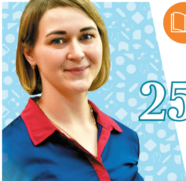
Фото: Андрей Ткачев. Коллаж: Анастасия Шевцова

Чтобы охватить наибольшее число учителей, размер гранта составит 250 тысяч рублей. К слову, пройти интенсивы педагоги смогут не только на гранты. Ведомство планирует отправлять их в образовательные поездки в научные центры. Также органи-