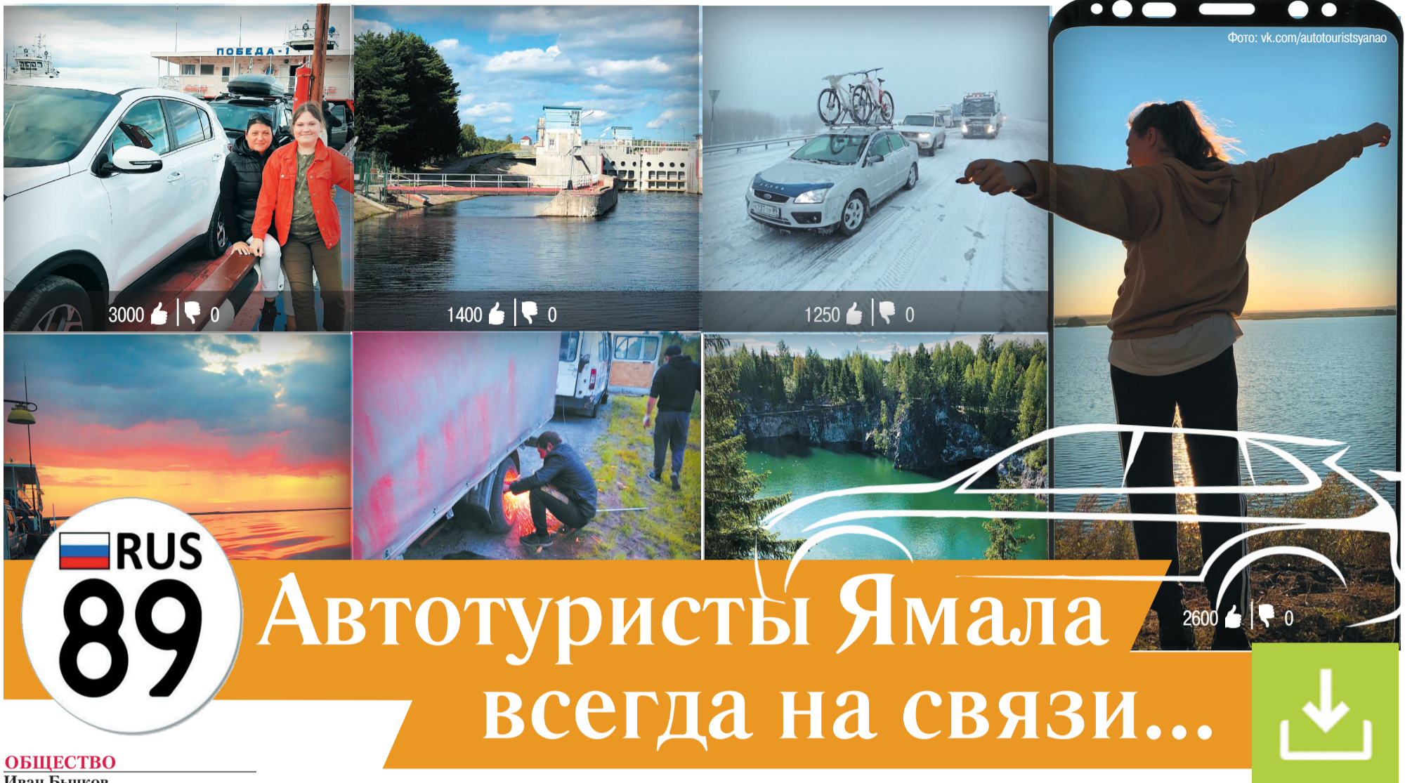
Фото: из личного архива Михаила, администратора чата «Автотуристы ЯНАО». Коллаж: Луиза Мифтахова