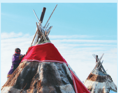
Сидяңг: Марина Яр' таттамы"

Ты" саполана ирыхына округна" һарка ерв' тасалковам' марцьхэхэ"ната мэ"һаць. Пыдо' нэрм' тер" ила' нямна лаханаць.