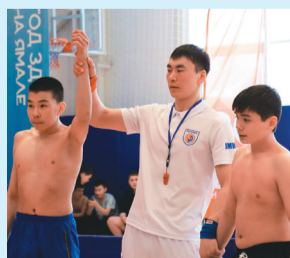
Сидяңг: уамал-sport, уапао няд ханаы"