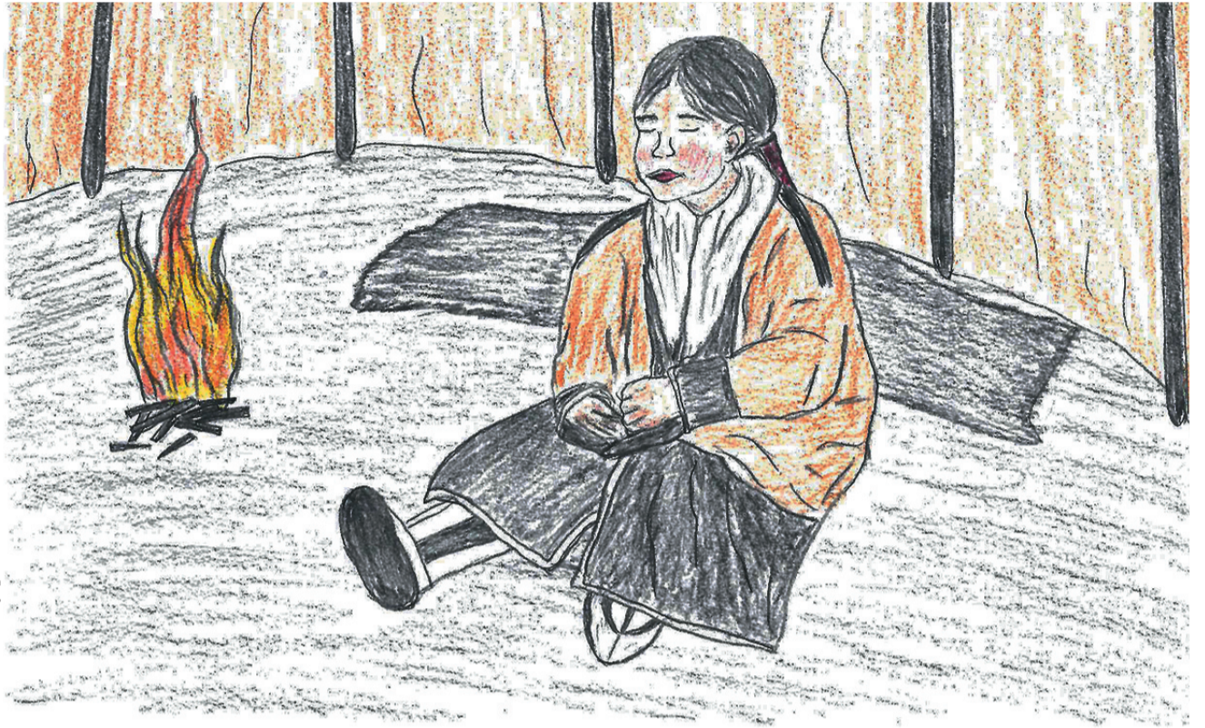
Падта"ма": Руфина Окогэгто' падтавы"