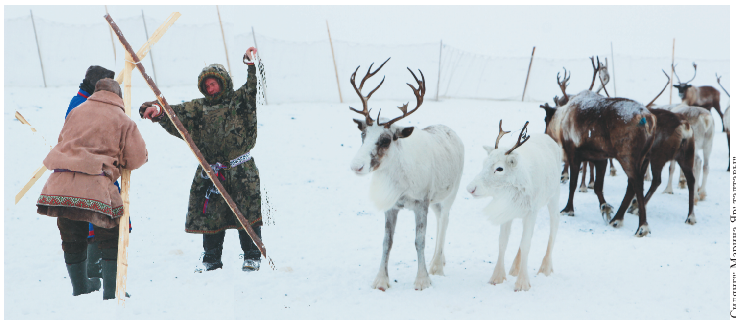
Сидяңг": Марина Яр' тадгавы"