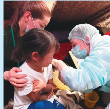
Таттама: Автор: Лариса Айбаседо патмы

Чуки пома" – де- чашама пуңэ тунды, Ямална җадка ведв' таньше тасламы. Дечашама – ненэй җадкамана нешант тада. Чуки ноптуху- на кулкади" кавша" нҗчимшту".