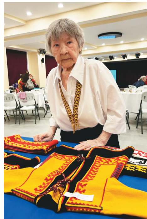
Елена Николаевна тамна пэвры