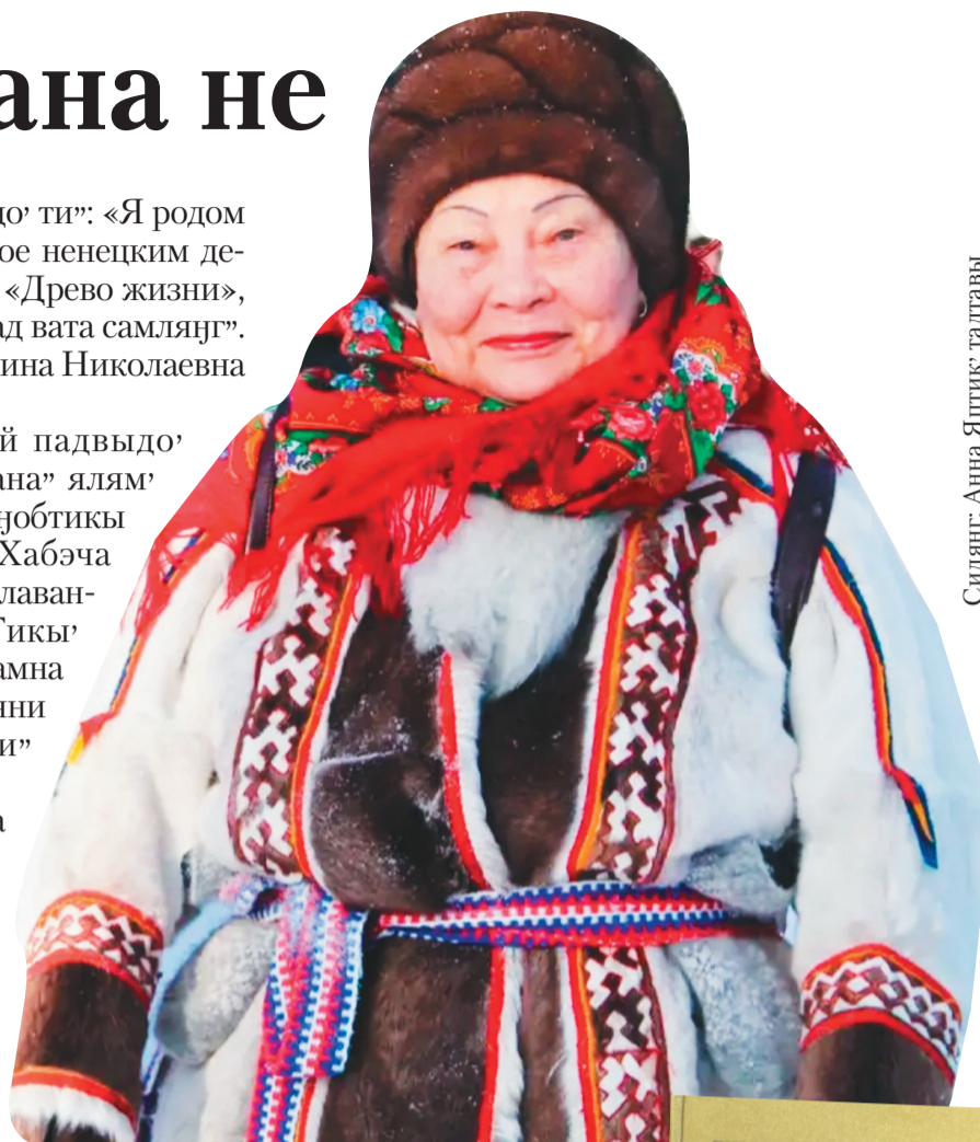
Сидяңг: Анна Ялтик' гадтавы

Сие ниць иры' сидя юкад вата синддетимдей яля' Саляңгарад' тер" 80-й соя"ма' ялянда ед' ңобт' ма"лурҗаць. Яна" тер" юнета нява" майб-тамба сава вадари мэ"ңаць. «Няръяна ңэрм»' редакция' терҗэ ңобтики танияна мэваць. Теда' е"эмнанда ңани' лаханава": «Нина Ни-