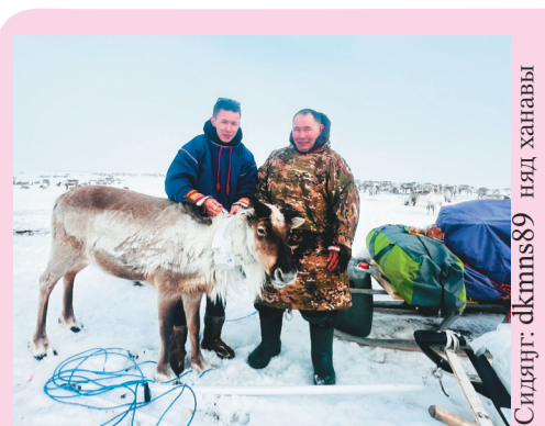
Сидяңг: dkmns89 няд ханаы

Российская Федерация Ямало-Ненецкий автономный округ