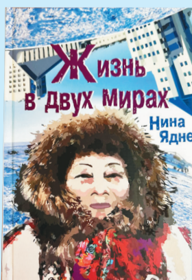
Сидяңг: Марина Яр' гадтавы

Нина Ядне Россия' нардавна юнета пад- нана ненэй не. Ямал- на" тер" сававна тене- вадо'.