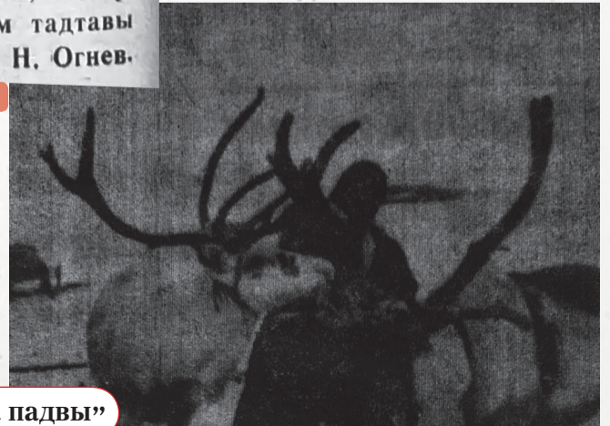
1990 похона падвы'

на редакторкана цэда-рамбида'. Сидяцг' цэя', лаханако', иле'мя', пад-тавы' рисунок'.