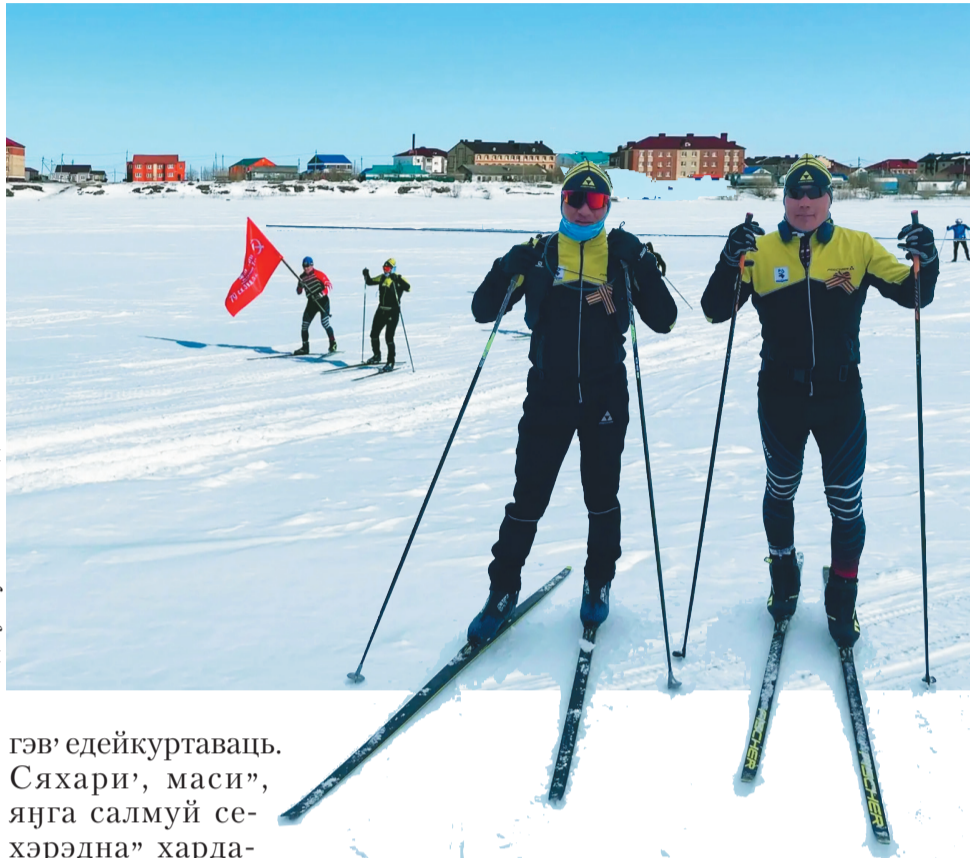
Сидяңг: уамалһмс няд ханавы"

– 70 километр, пирт, пон, ниваць мий". Пуна сырада нюлартась, ламбина" тадаңга пэйдаць, һайхад сы"һась. Нёдалавана" нерцю" теневаваць – нензел" ни һэңгу". Манзяв сидя иры, пирт, пыхыдами һахакуд хамэдамбивась. Ялэхэ" ламбитасетыдм, ханяһэхэ"на яляхана сидя, хэсетыдм". Яңга е"эмняна" тарця ялям, сертавадо, ихиня ёльце сава. Теда, манэ"һава", хахаяда" хардахана ламбитавам, мэнена" нина" һани, таниявы". Ихиняни по, ямбан, ламбитаван, харвасетыдм, та, лыжероллер, мэць пир"мы һэхэваб"на", һобң-