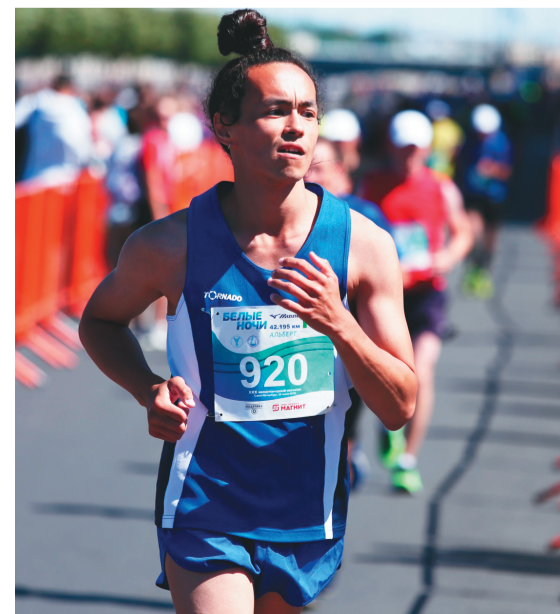
Сидяңг: vk.com/otokote няд ханавы”