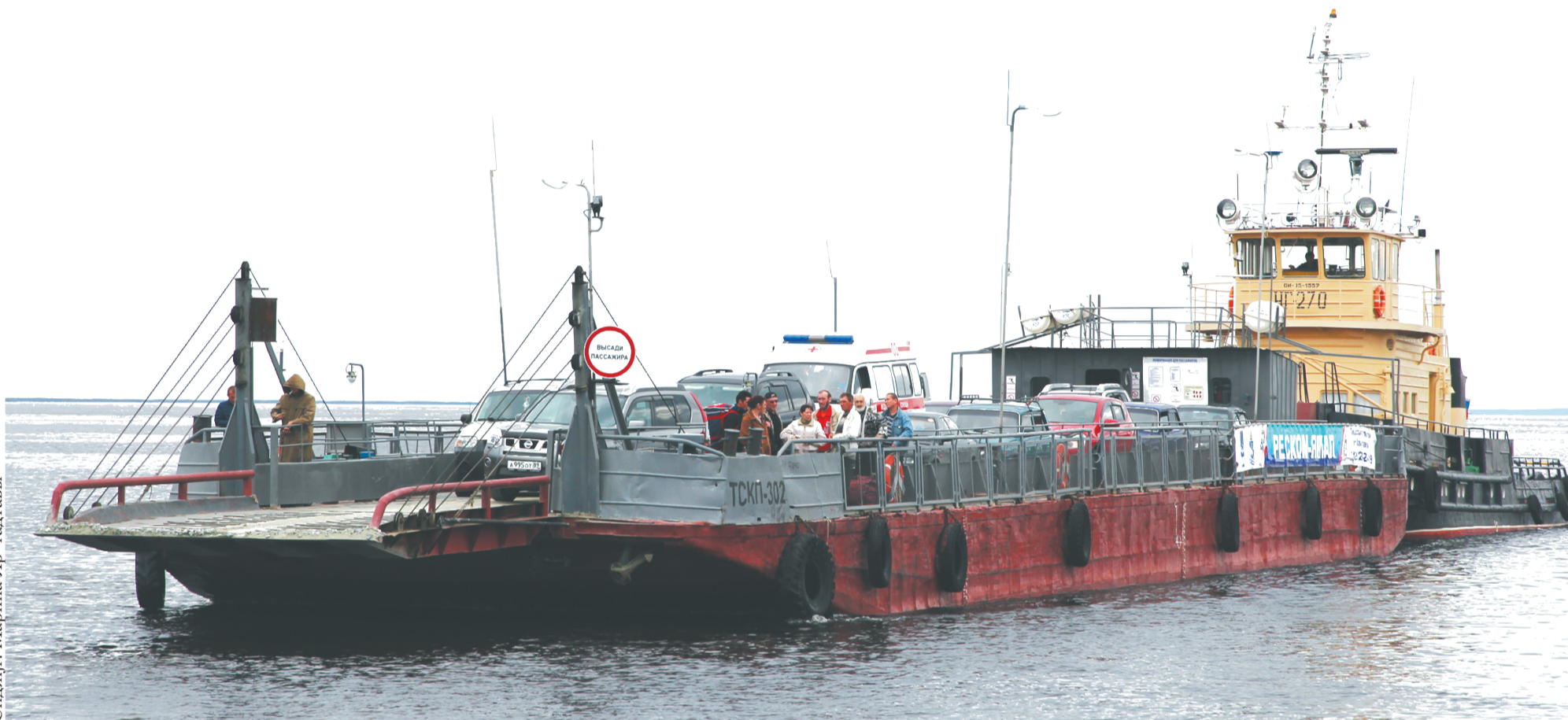
Сидяңг: Марина Яр' гадтавы

Саля яв' сэр" нюртей мэва' ты ниць иры' юкад вата нюртей яля' хая манзадась. Тарем' нод" яха' ерки ңарханда сырэйнда пирась. Салехард' няби Лабытнанги' яха' варри" икана пан"ңаць. Палытана" хибяхартм' салаба' сэрт' ниць ңэдарабю".