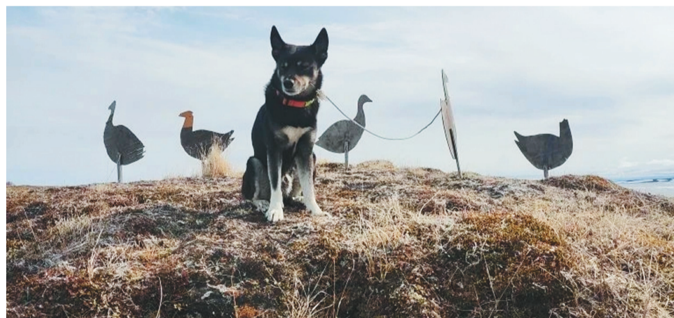
Сидянтг: Хабэча Ёунгад' тадтавы

Хаця џарво"махаданда харта мята тер" едм' пандабандаџэ хэвы. Сидя хасава нюндя џарво"махад нюхуюта ня' хане џоб" ядэрманз' хан"џа. Ёавна нисянда ваде"мы" табеку сидя илебей ненэцянд' џани' тид" ваде"яда. Ёобтики вада, сидя џармы хасаваха' нисяхаданди' ханевам' тохолоавэди'. Харти' теда' вадёдана" хасава нюди' џани' ябто' мякана џамдэ тохолоамбиди'. Тюку нара' џоб" мяд'