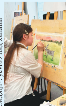
Сидяңг: усчг89 няд ханавы

Яр-Саляхана тохолкода" ңобтики падтаңго тоходана". Пыдо' «Юный художник»м' нюбета падтаңгурти" ңобт' ма"люлаңгалава' ян' ядэрңа". Ңопойнядо' Мария Ваной Сочи' хардан' хан"мысь.