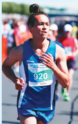
Сидяңг: vk.com/otokote няд ханавы

Окоэтто Альберт – яна" тиргэвна юнета илебей ненэць'. Пыда сёётэй ңэванда хавна тамна сёбар" серо нерня' тидхалемби. Ңани яхана илебата ңод" соя"ма' ямда нида юрыбю".