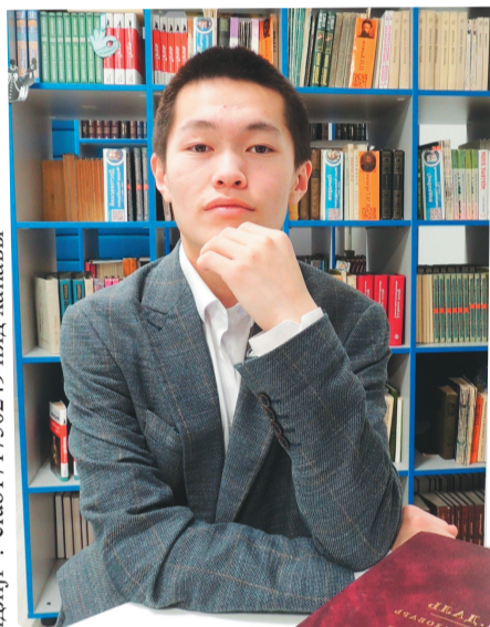
Сидяңг: club171750249 няд ханаы