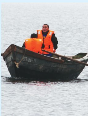
Сидяңг: Марина Ярой’ тадтавы

2026 похона мю- серта” нина” нядәң- госэйдэ’ хаця һок- маць. Хахаяда яля’ һани’ сава юнм’ нам- даваць.