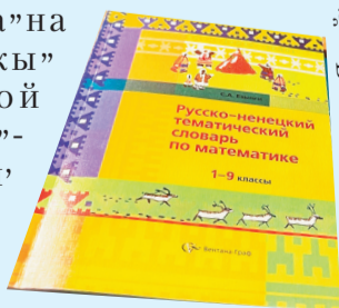
Сидяңг: Марина Ярой’ тадтавы

Ямал’ школаха”на тохолкода” һацекеы” Северо-восточной олимпиадахана ва”- лэй” һэвамдо’ һани’ манэ”лабтадо’. Не- нэй ненэця’ сидя вадандо’ харавна: Пяко”, выңгы” не- нэцие” вадавна падна”.