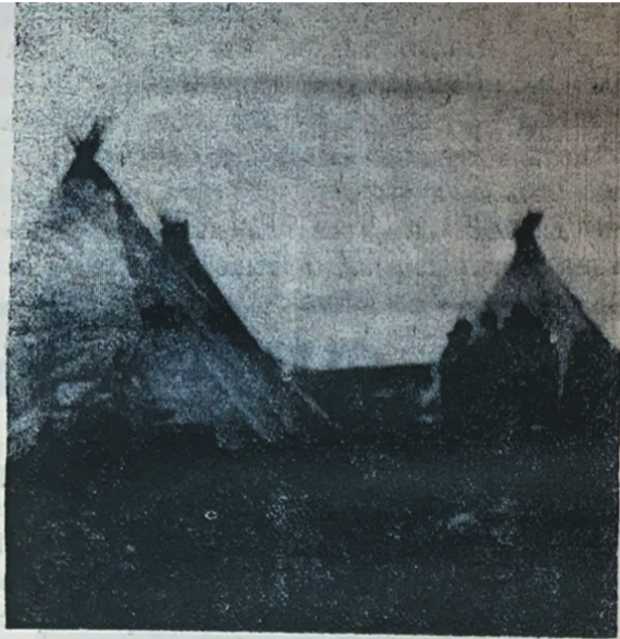
● ТЫ ПЭРМА