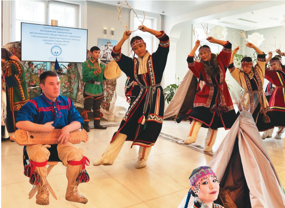
Сидяңг": Алексей Салидер' тавы"

Юд' по' тяхана Санкт-Петербург' няна тохолкода" Ямал' тер" илебей" ненэця" џобт' ма"льщ. Тев' тенат' тикы пявы серто' тамна нерня' миџа. Тарем' толаб", џокханда няхар" ёнар" мат" юр" самляңг ю" яля' џобкана мэ". Теда' несэй" џацекы" ненэця" ня"амбидо'.