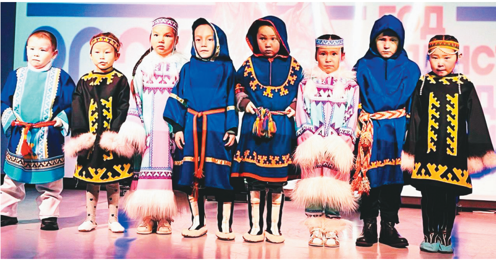
Сидяҥг' ранаевскдк няд ханааы"

Тандая' ти, таняна концерт ҥась. «В Единстве Сила» нювм' мэ"ҥась. Культура' мякана манзарана" харад' тер" нито' е"эмня ноб" няю' нятва' нямна хыно"ҥаць. Концертан' сыр-манзъ товы Алёна Ҧокэй вадамда мэ"ҥась: