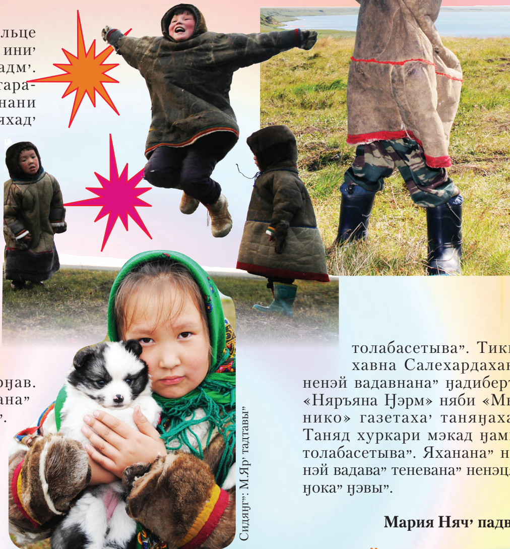
Сидяңг": М.Яр' талтавы"

Теда' школахана җод" җобтики ненэй вадава" тохоламбива". Тики урокана" ёльце җатесетына". Сидна" тохоламбадава" харе" вадавнана" нянана" лахана-курпата ёльце сава җэсеты. Лахана ненэй ненэцяҗэ мал" пир"җава". Паднава' сер" тое-нарка, җадьбяна" етри' тыха-совна инзелесетыва". Толаҗго урокаханана" ненэй ненэцие" падвы стихотворений, иле"ми