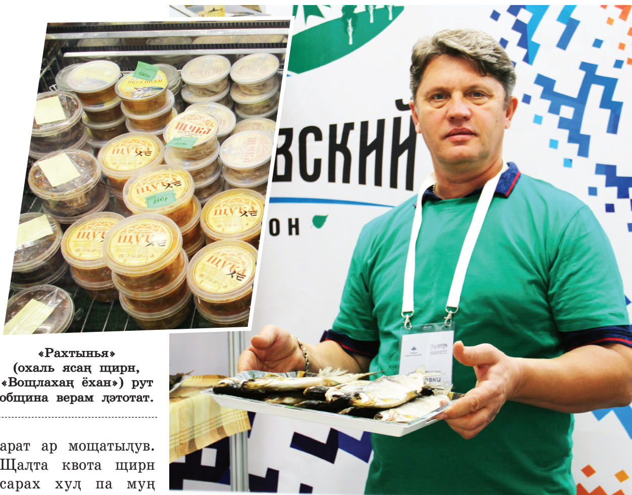
«Рахтынья» (охаль ясаң щирн, «Воцлахаң ёхан») рут община верам лэтотат.

– Щита вер элды туңа-щира ястатя ант верытдам. Ванты, квота нэпекат патан ант тайдам. Туп муйсыр худат муңева там ёхи хащам талат сус ёша пайттыя рахл, щита вер элды потартыя верытдам. Государстваев элды муңева юкантам квотайт щирн там йисн общинаев нялак худ велпаслатыя верытл, руц щирн лув тугун муй сосвинской сельдь нэман маса. Щимащ нялак худ муңева там кутн шеңк ар ищипа велтыя ант рахл. Ванты, лув еша улды ёханлувн иса щита антома йил. Ёхи хащам талатн паннэ, сорт, мевты, келци па цапар худат ям