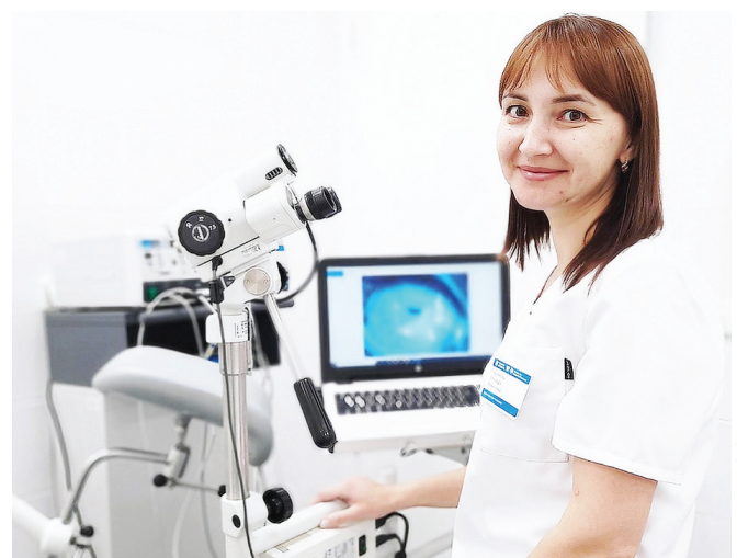
Хор: ЯНАО леккар хат департамент