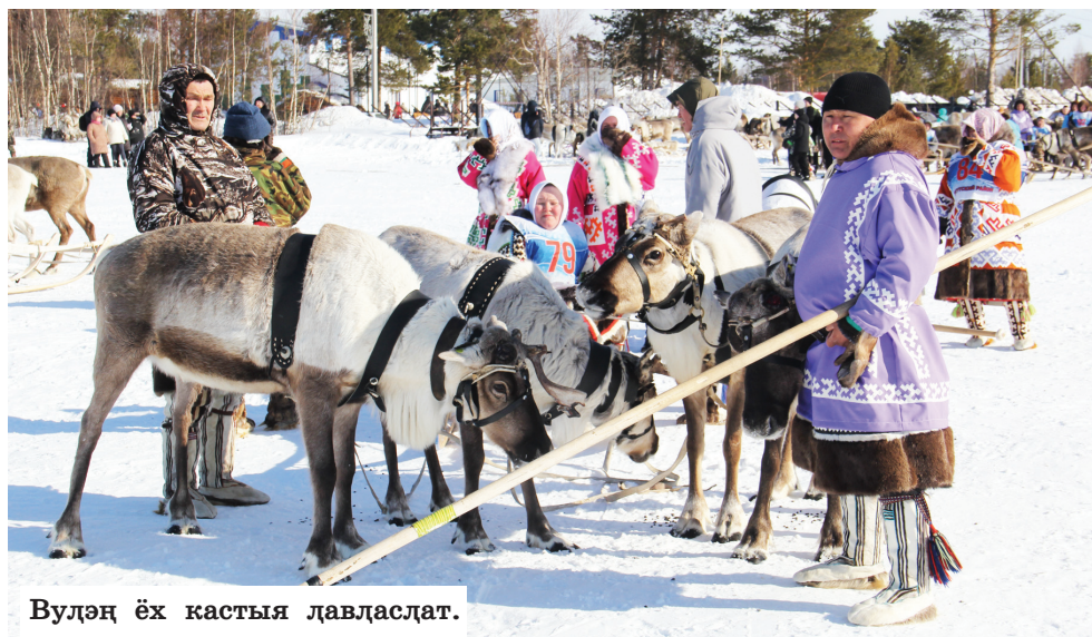
Вулэң ёх кастыя лавласлат.

Кашң ай муй уншак хоята тата шеңк умащ ус дыед ванттыя па худанттыя.