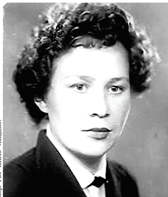
Хор: ГБУ ЯНАО «Мядико»

«Ма Волаң Ляль пинтшам порайна холна сэңк ай осам, нил талам ос, топ ма ищипа пци порайт эвалт мала аса номлам. Номлэм, хоты ащем ляльна манас, ма номсамна хоты ма хонт оцсам, мала – щит ляль, топ оцсам, щит мала кепа сэңк атам ат. Ащем юпина вул яйм манас.