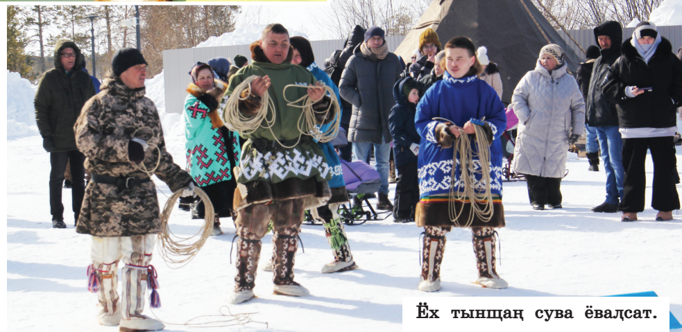
Ёх тынщаң сува ёвалсат.

мет пуш постаты питлуд. Щимащ волаң вер ураңан кашң ай па ун хоята ям ясңат ястадам, лудан нын иса вецкат номасн ат ёхатсайты, касты муй тынасты па щутщаты вердан туңа-щира, туса елды ат мантсат. Ванта, Сорханл районан ёхи хащам талатн ханты ёхлуд мет ун тайты вуды тащат