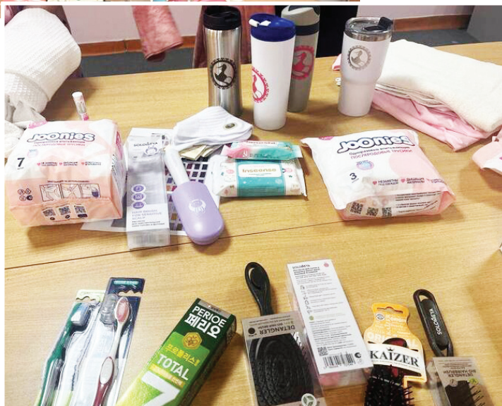
«Мойлапса дараща понты пормасат»

Мет олңа нэңата альса, олаң сыс актаң «Ямал мув аңкия» мойлапса дараща муй понтса: венш мухты кат сох, леккар хотан думатты ернас, кура думатты щашкан вайңан, лёхитыты па венш сыстаптаты пормасат куншап пидан атэң ай хирсохийн тохи акатман усат.