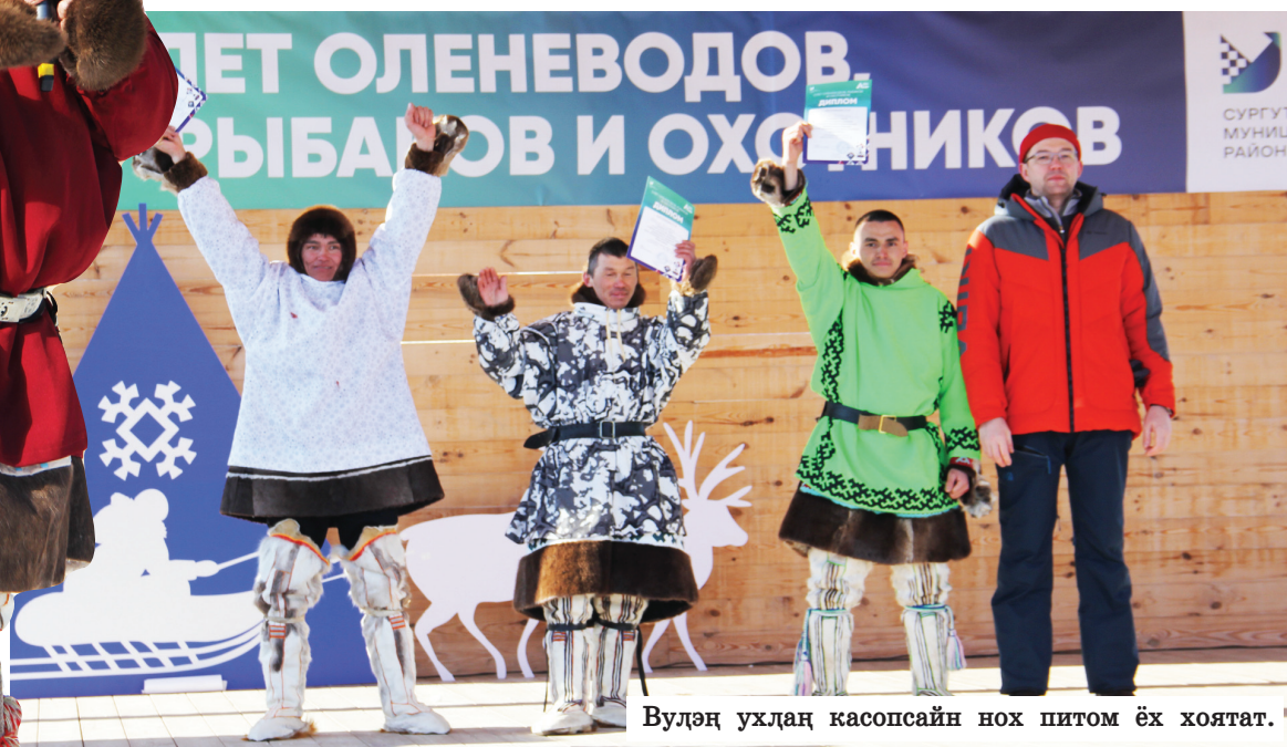
Вулэң ухдаң касопсайн нох питом ёх хоятат.

Хащам ятан Русскинской куртан Сорханл районан рут щирн мув тайты хантэт «Вулэң па хул-вой велпаслаты ёх емаң хатлэл» хорасаңа постасат. Тамащ уйтантопсайн вантсэв, хоты туңа-щира па ошаңа-щаңа улты ай унт куртан улапса щирдал лэщатты хантэт Туром ёхан хуватан лый кутэлн кассат.