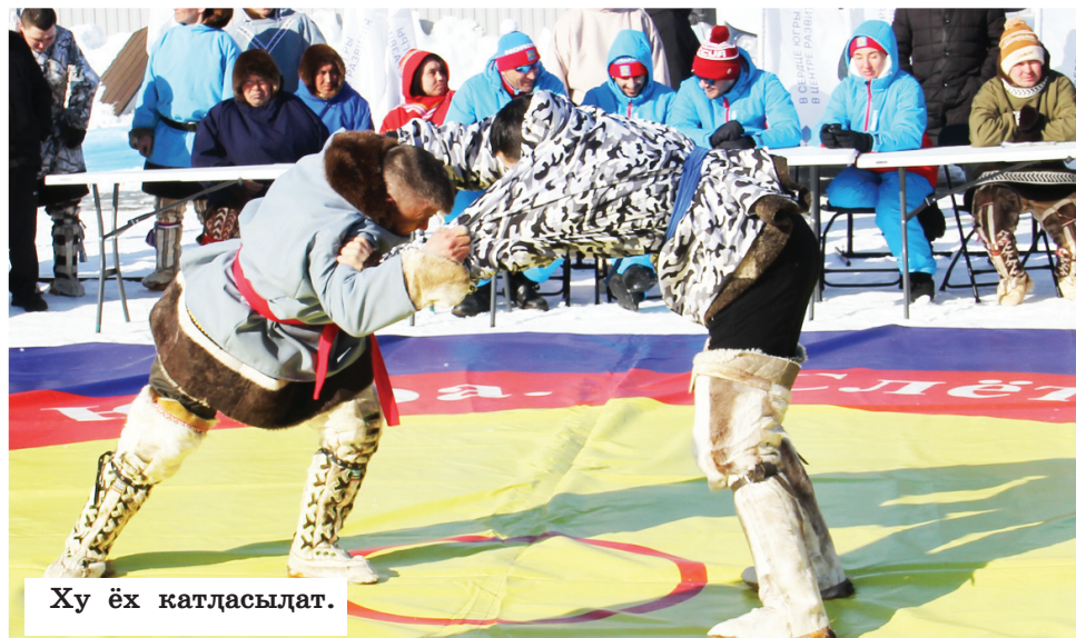
Ху ёх катдасыдат.

Мет олаңан тый актащам хоятат елпийн Ас-угорской «Хатдые» нэмпи якты па потрат ванлтаты таха ай ёх ханты мир якат туңа-щира альсат. Лый юпелн па «Ёмвош ёх» арыты хотаң нэңат мир елпийн сыр-сыр ай па ун арат шеңк умща арысат.