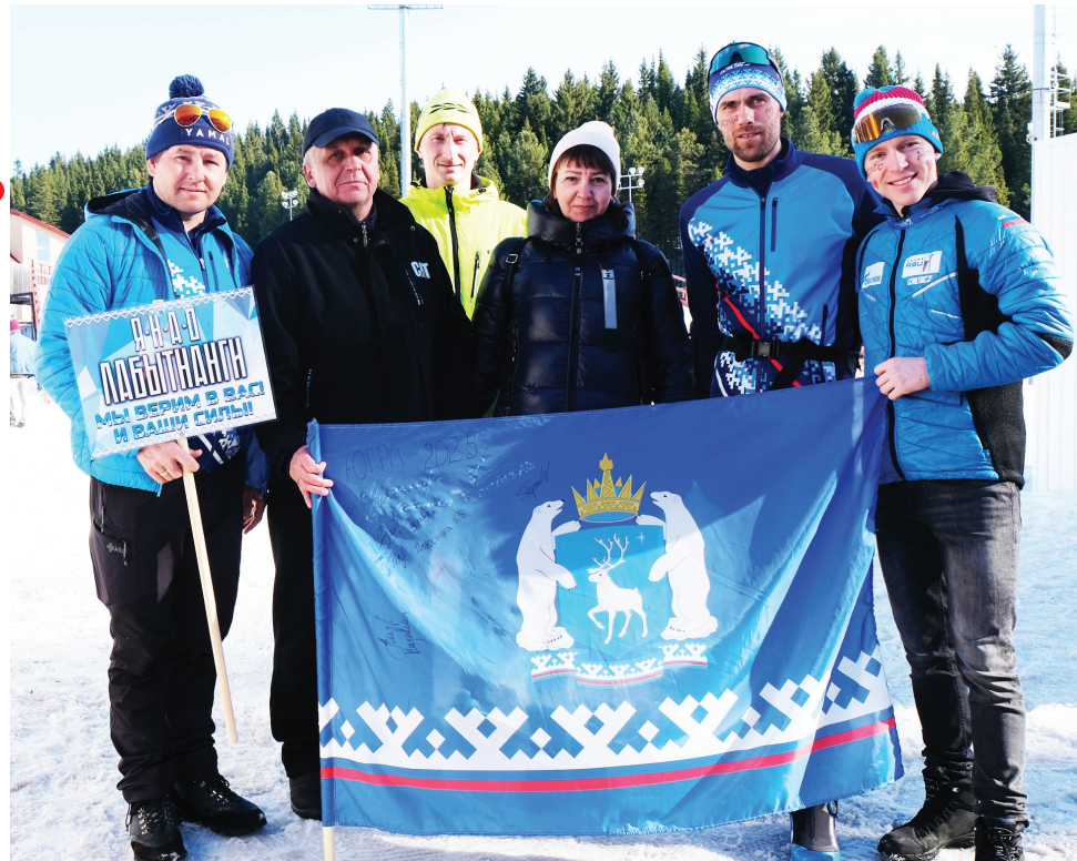
Ямал мув команда.

Хасям лапатан Ёмвош округан дохан хатэмиты па пошкан элты орытты Хон мув чемпионат манас. Россия мув суңат па Белоруссия мув элты ёхтылым 185 хоят няд хорпи касты ятан юрацсат.