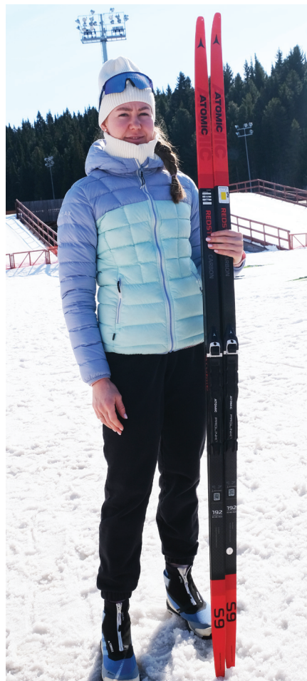
Полина Плюснина Ямал мув команда лүңтасал.

Хасям лапатан Ёмвош округан дохан хатэмиты па пошкан элты орытты Хон мув чемпионат манас. Россия мув суңат па Белоруссия мув элты ёхтылым 185 хоят няд хорпи касты ятан юрацсат.