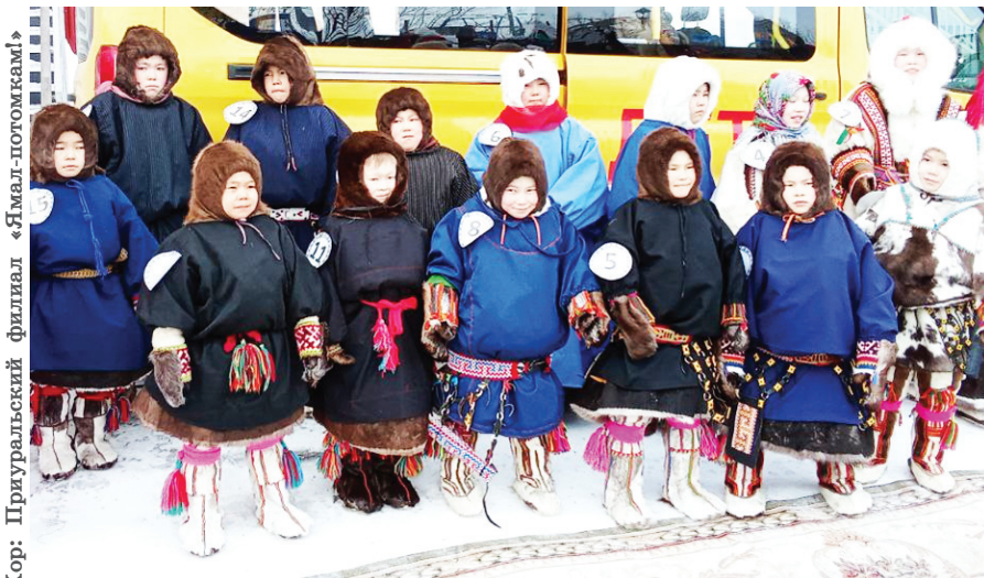
Хор: Приуральский филиал «Ямал-потомкам!»

Лув кутдална Вячеслав Худи па Владислав Климов, дын интернат нявремат эвалт лапатхощёң талданна Ямал мув северной многоборье Сборной хоца лоңман оллаңан. Охал соппы наварты тахайна алаң тахайт вуйдысқан, районной, окружной па всероссийской касты харатна ар пус нох этыдысқан. Майдата ёхтам нявремат ораңна мастер-классат эттасқан, хоты охал соппы наварта, тынщаң воцкемита, юх талта масл.