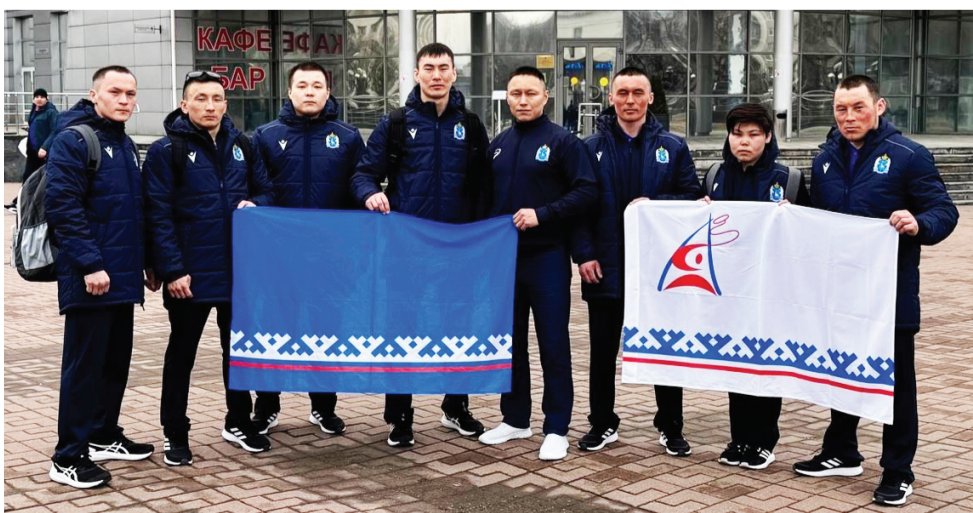
Сидяџг: maswrestlingru няд ханавы'