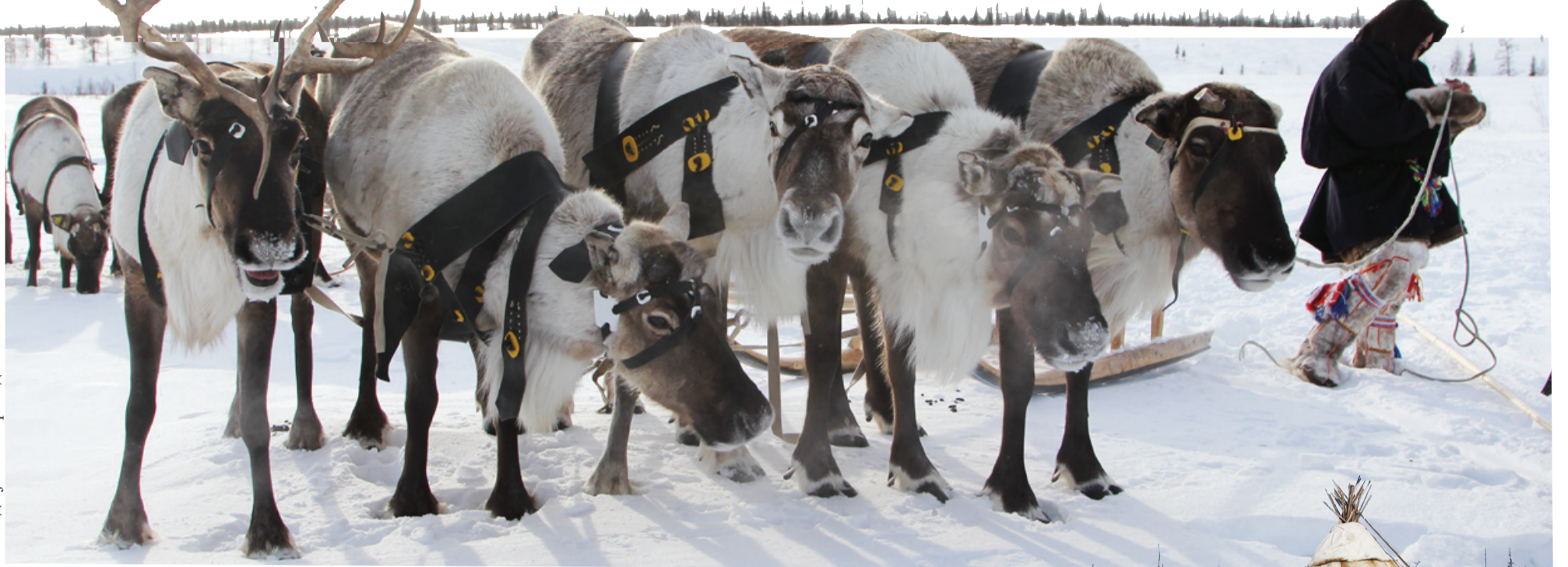
Сидянт": М. Яр' тагтавы"

Хардахана илена" ненэця" ядембада нумд саць маямби". Пивня ядэрць мыры" тэри сялкадарҗа". Маня" выҗгана вадёвэҗэ тарця маябцо нина" хамедамбю". Нюрте"э" иба нумгана ина" ядэрабцо" мюсерта ненэциена" нямна ханҗа". Пыдо' иландо' нум' хурка җэвахад пере.