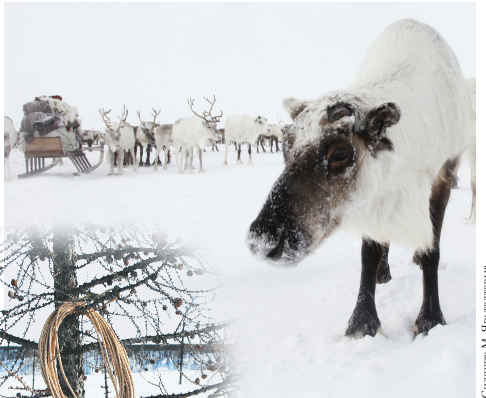
Сидяџг: М. Яр' галтавы'

Хэвы си'ив яляхана Тазовской районхана ерводо' вымна џэдалёрџаць. Пыдо' тыто' хадо' хурка џэвам' манэ'сарџаць. Тарем' таславэдо', ты пэрти' џэсыхы' комбикорм тэврамбаџу'. Тамна џарковна сэрдаџэ