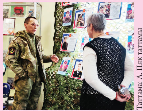
Тагтама: А. Пяк тагтамы

Российская Федерация Ямало-Ненецкий автономный округ