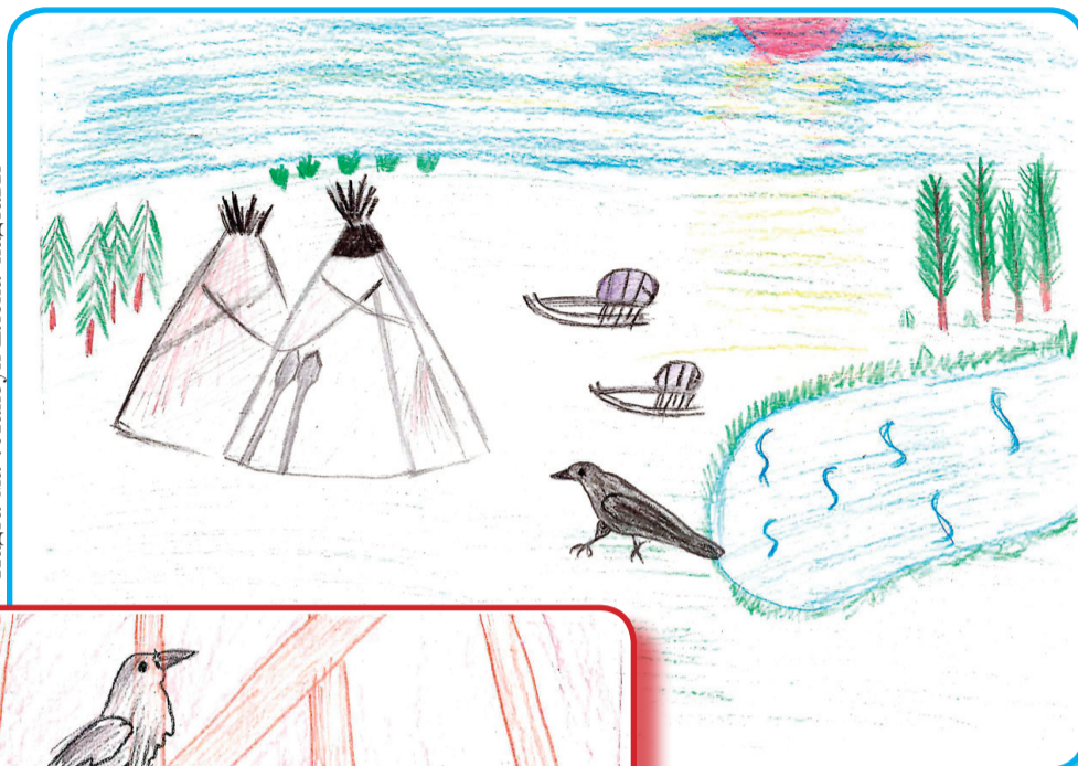
Падтама": Лапсуй Елена' падтавы"

Тэняд писянзы ненэця" тута", вадетадо', хуркаҗэса, ханзер" лын-