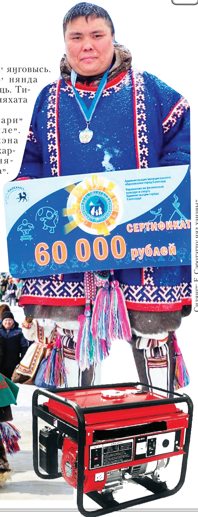
Сидяңг' Е. Сэротэтто' няд ханава'

Яханана' хуркари' сава' ненэця' иле'. Нямгэри нямгэхэна нидо' нядабидо', харто' пыхыдато' ня-римна ни' няркана'. Ыадимдембада' серодо' тидпой' мунзи' минрейдо'. Тарця нина' теневабна' тара'.