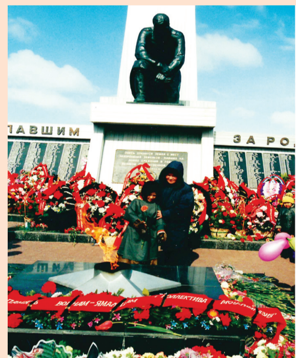
Сидяҕ Х.Яунгад тадавы

Матрук (Мотрук) ханяна сайнормам', сян по" танияна мэвамда, сайнорма по' пуд иле"мямда ехэрава". Тедари' ехэрава".