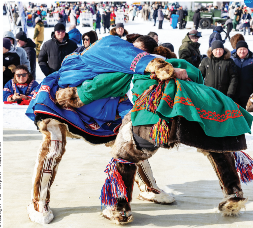
Сидяңг' А. Чирва' тадтавы