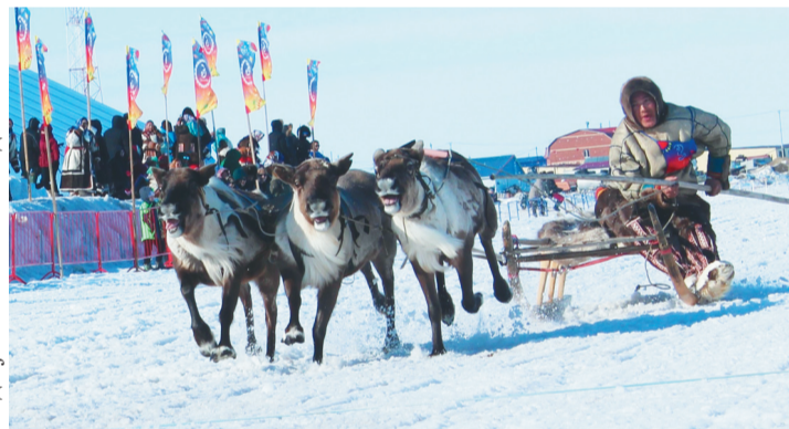
Сидяңг": Анна Яптик' тадтавы"

Маня" «Няръяна Ѓэрм» газетахана манзаранаңэ Яр-Салян' мядоманзь хан"-ңаваць.