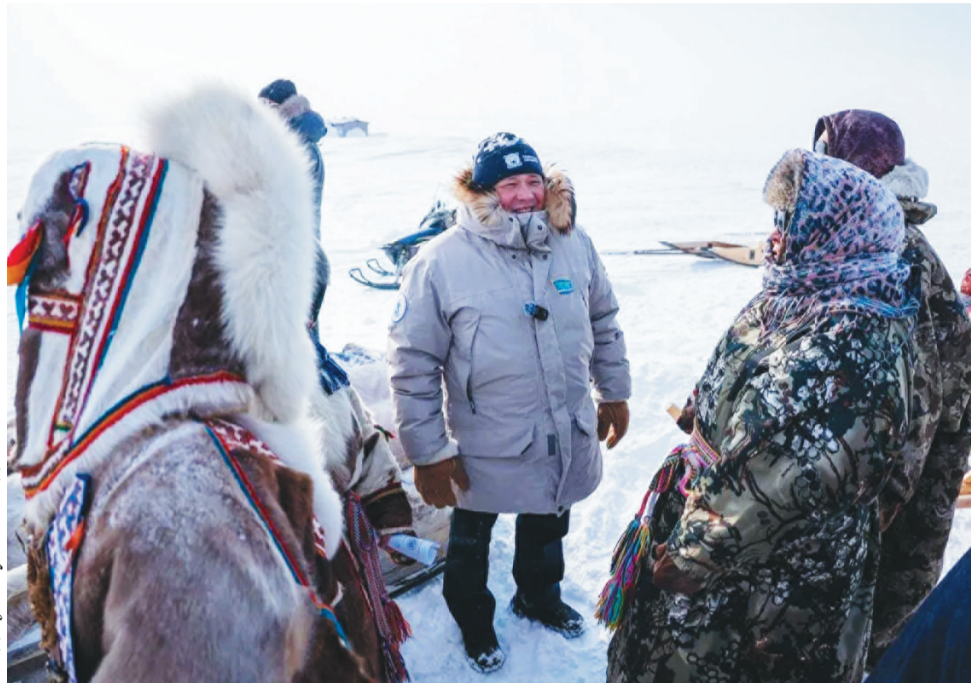
Сидяңг: зууапо няд ханавы

Пыдо' невхы иландо' саирм' нэданаха"на нэмгэ таравам' тидпой" нянандо' лаханакурць намдаван' харва". Нэдя вымна