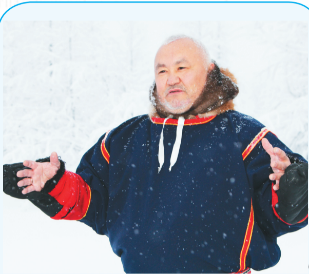
Сидяңу: Марина Яр' тадтавы”