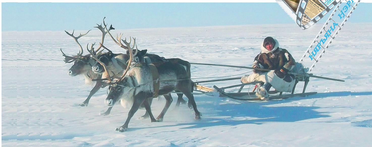
Сидяңг: Марина Ярой' тадтавы

вадавнанд пандамбир, невхы вахалць мэ"мы небянд вадам' тамна' тяха' минрен. Газетамд пудана ваданда ёльцянд' толад". Маня" паднанаңэ е"эмняд хусувэй си"ив яляхана варева" мэ"цетыва".