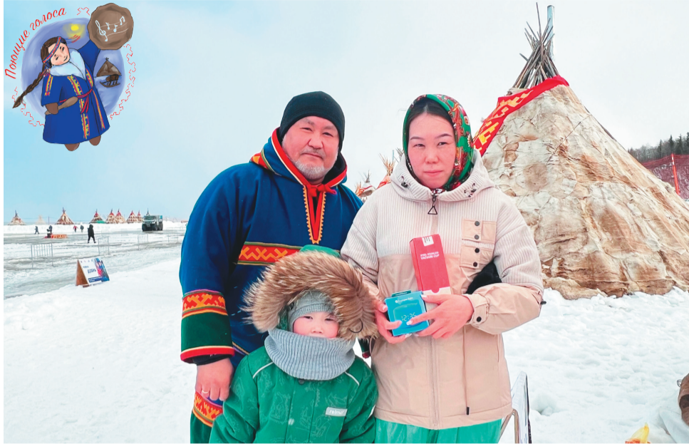
Сидяңг": pouushiegosla няд ханавы"

Тасу' хаби" вадавна Виктор-ия Айваседо хыно"ңась. Пыда «Дарите женщинам цветы» сём' харта вадавнанда мэ"ңась. Сита нюртей ян' мэць. Хабихит Саляңгардыхы «Овас муви» сё мэта" няби Питлярхана то-