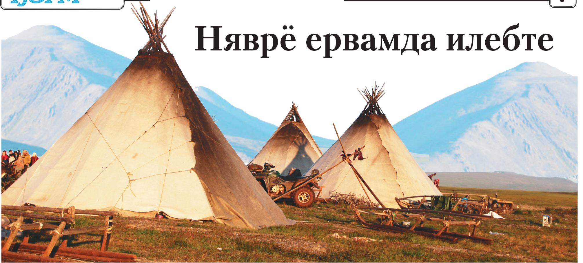
Сидирг: Марина Ярой' тадтавы"

Ѓоб" җэсына няхар" мя". Не- нэцяндот' мале җока, җацекиды' җоб" тарем' җока. Ѓоб" мэва' таҗы яляхана ненэця" ненсэй' ян' мюсе". Мядото' хэвхана җар- камбой юн' том' нермядандо' тасла җэсы". Җарка ненэця" мядодо' мярыби", тыдо' иле- бей ян' хадырць тэри лабцейд". Җацеки" нерманзь хэванзь ед- кодо' ня"марҗа". Некум' нюбета не җацеки харта пилипон' ня- ха"тата хэвнякумна ет' хурина мэван' харва. Теда' җани' пыда минханда нита нерня сюрамба хая. Терсяда едхаюта хэрна няби ё" вэт' со. Пумнанда Няврём' ню- бета яндо вэнекоцяда нявота ми- җа. Неку вэнекомда едхана лада- да, пуня' питарҗада. Вэнекоця ерванда җарковна сита лад"махад хаи. Пуйне тикавна хэванда сер'