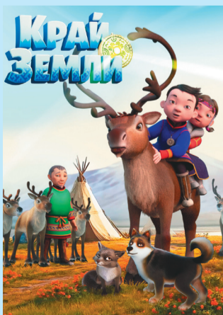
Сидяңг: «Край Земли» мультфильмхад сертавы

Небой та' Ямал' нямна җэда «мультфильм» җадимьясь. Нюмда – «Край Земли». Илна" нямна җэда падтавы иле"мярхам' луца вадахад ненэця' вадан' тэвравыдонзь.