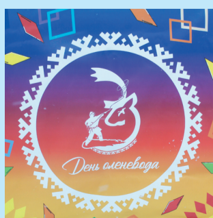
Сидяңг: Анна Яптик' тадтавы

Җани" пота тотрев' ты пэрти" сянакова' яля" ханярина җаць. Маня" юн' падарм' падыбадаңу Нядаңгардан', Хальмер" Седе"эн', Хоя" саян', Яр-Саян' тэворҗаваць.