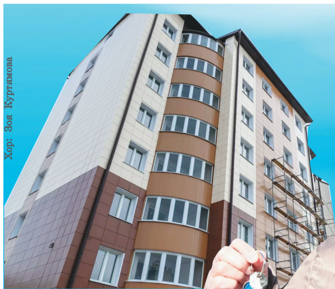
Хор: Зоя Куртямова