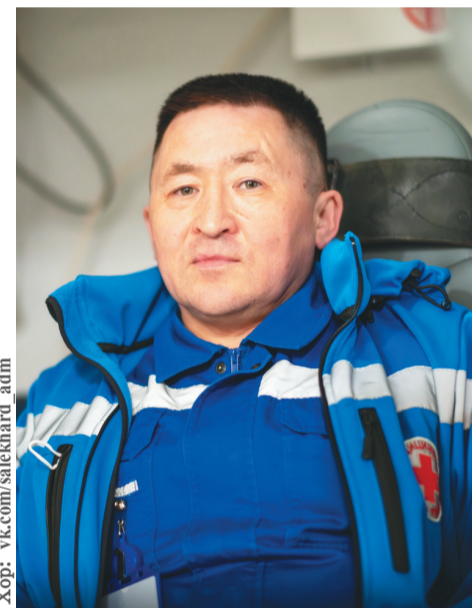
Хор: vk.com/salekhard adm