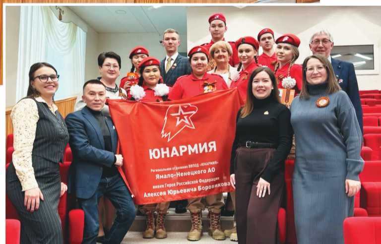
Охсар вош элды ёхтылдым айлат ёх.

потаргас. Щи щирн дув айлат ёх пидан Волаң Ляльн тапам солтанат каншлат, нэмдал нэпека ханшлат па ялпа лоттатат.