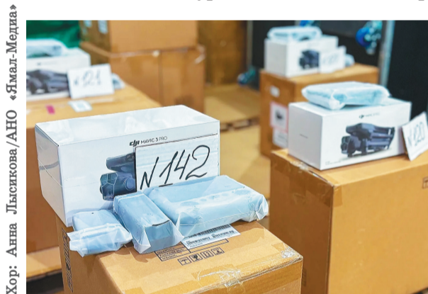
Хор: Анна Лыскова/АНО «Ямал-Медиа»