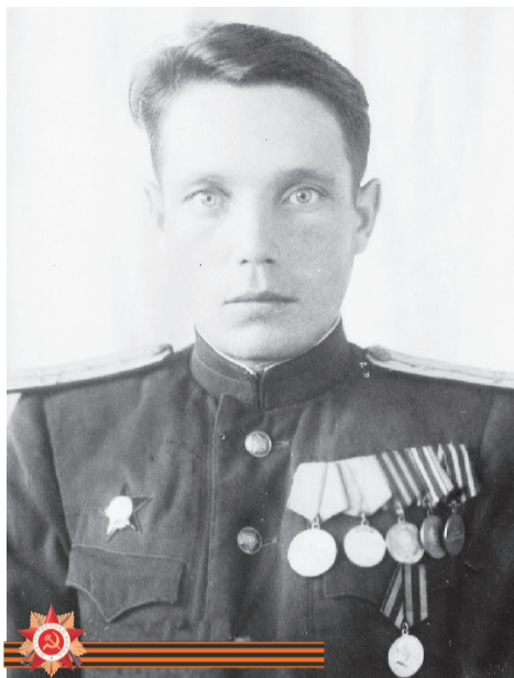
А.П. Загваздин ляль едпийн Асов курт рыбкоопан рупитас.