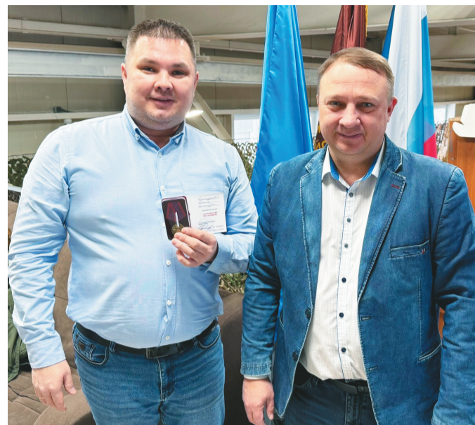
СВО педа нэтап пормасат акатман «За мужество и гуманизм» нэмпи мевал посан мойдаптаса.