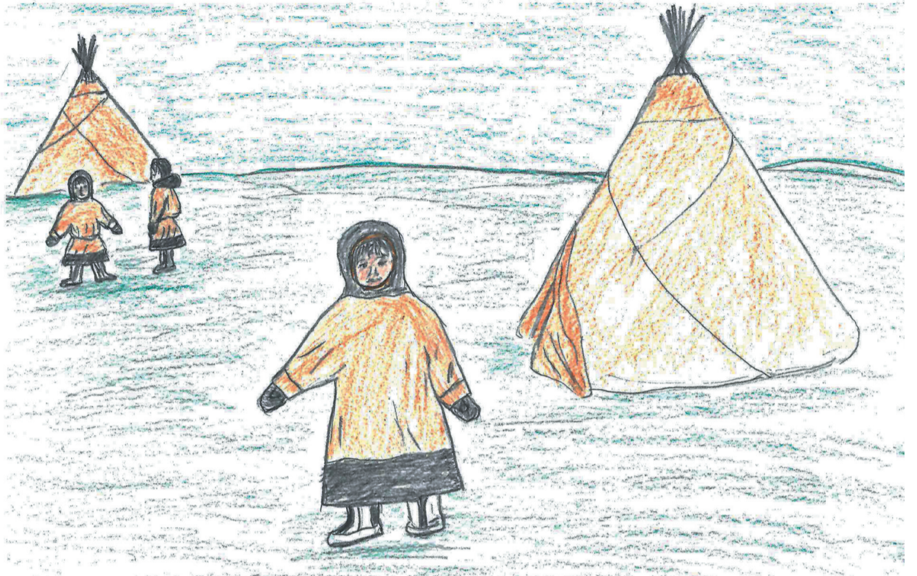
Падга"ма": Руфина Окотэгто' падгавы"