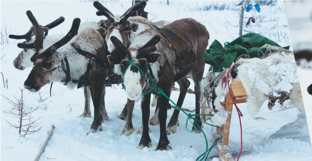
(Нердена пеляда 1 стр толара')

Нарка лахарёва' лакри' вэн' мад' лаволасетыдо'. Пихиня ты' туро' һамгэ' мянувна сидна' пин' пароламбатархаць. Һамгэри' нямна лаханакурпана' һод' вадина' пили' ты' ила' нямна хан'һаць.