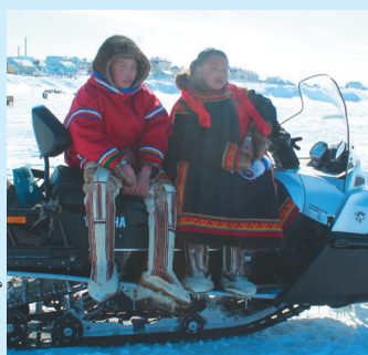
Сидяңг: Анна Ялгтик' тагы

Тюку иры' ёльцяңгана хой' тер" җацекеы" мале мякато' хэсеты". Иде" хэва' нерцо" сиддо' небянадо', нисянадо' хо-саясеты". Ты" ниць ирыхына яна" тиңгывна җэда" интер-нат" мюй" тер-сялворҗа".