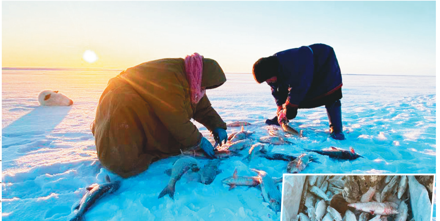
Сидяңг: Марина Ярой' галтавы

Тадри' ненэцие" есяха"на нядабаңгудо'. Ты" ниць иры' юкад вата нябимдей яляхад няд"ма" есян' харвана" предприятий" падродо' мале җэдарамбабато' серо"җа. Җоб" тонна таросяда халям' (пыри", нёя", лысу") ватава' няю' 136 есям' җоб" кила' е"эмня салдаңгу". Җахат тикадо' яланда юр" сидяю" есясь. Ерводо' предприятийха" нато' недбидо' харто' недво"мы" есяхатато' салдамбаңгудо'. Няд"ма" есяҗэ тур-