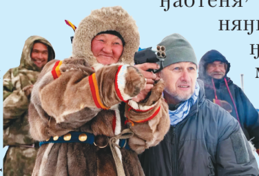
Сидяңг: vk.com/assoc.yamal_potomkam_нд ханавы"

Сэр" варк" илесь' ёдо' Итя җабтены' няна җа. Ха-няңы" Я' мал' тер" җахат таямна мюсерҗа". Тикы я' сармик закон' вато' сер' лэ-трамбада. Не-надо «Крас-ная книга» нубета падар-кана пады.