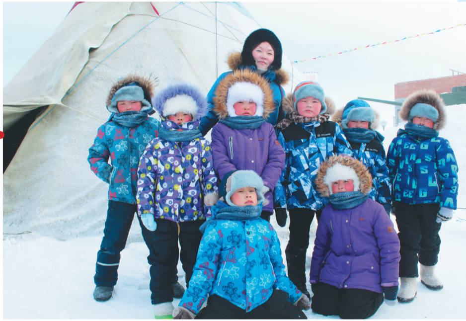
Сидяңу": Анна Яптик' талтавы"

нэбт' мэсь таславаць. Ѓанихив" мал' хой' ня' хаяць. Ѓули" пуда' хаёвыдо' ты" ниць иры' сиднде-тимдей яля' пиркана, хэбидя яля' нерцю" ханэйдонзь. Тамбей' вы' няд нэдина" ты" ниць иры' 15 яляхана ханда". Нидо' ёльце