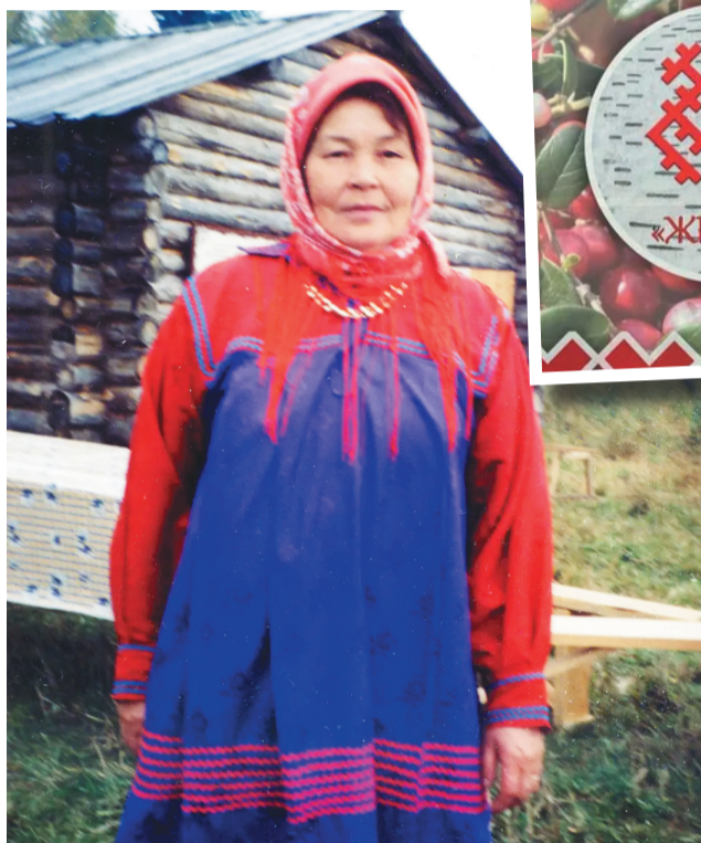
Ханты-Мужы куртан улты йис паварт хотат нох лэцатсайт.