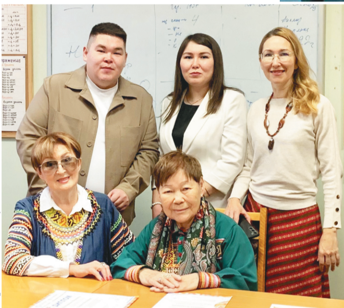
А.И. Герцен нэмпи хотан уйтантопса порайн. А.С. Сопочина ям пелакан омасал.

ханшман яңхсат, щалта мончат пилн киника эсалсат.