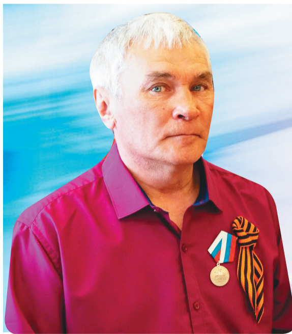
Леонид асед – Юрий Михайлович Тохма, апраңа па юраңа энмадтам пох ураңан, «Отец солдата» мевал посан мойлаптаса.

Наро-Фоминск вошан духсэм рупитас. Лув манэма нётас. Лапат сис нэпеклам акатсам па мохты Изюм воша мантсам. Одаң сита ляляссув. Вошев хаймев юпийн, Купянской направление хося хулам тал усув».