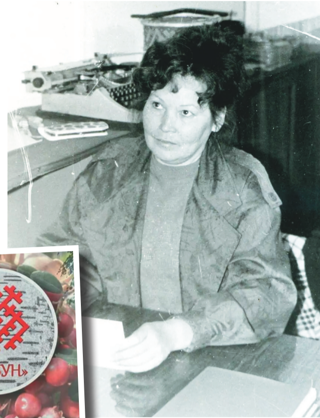
Ольга Самсонова куцая рупитмал порайн.

СССР учёной хоятат пидан потремийс. Щи тумпина Литва, Латвия па Эстония муват этнограф хоятат пидан рупата щиран уйтантийс. Катра йис пормасат мир доватан Пулцаватан, Хон Петра вош Эрмитаж хоца па Нью-Йорк Метрополитен-музей нэмпи тахаятан, эталтысайт.