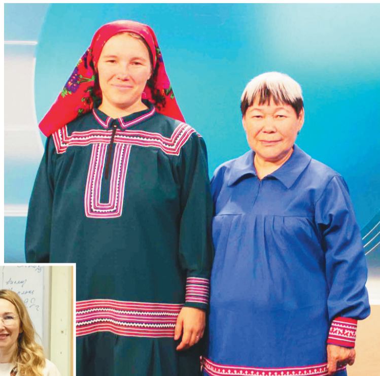
А.С. Сопочина ям пелакан лойл.

А.С. Сопочина 1991–2017-мет талатн Ас-угорской научной институт Сурханл филиал рупатнека, щалта куца нэңа ус. Щити порайн ияха рупитты ёхлад пилн Сурханл район хуват йис потрат, мончат, арат нох