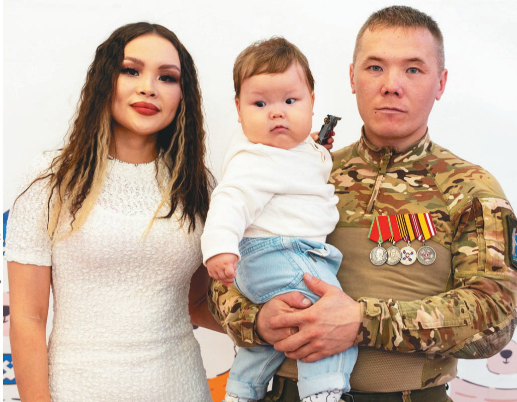
Леонид па Алёна ийимел пидан округ элты хот дутты сертификатан масайңан.