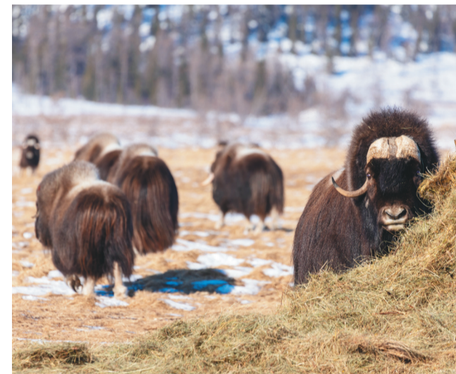
Йиңки доран энамты па улты войт.