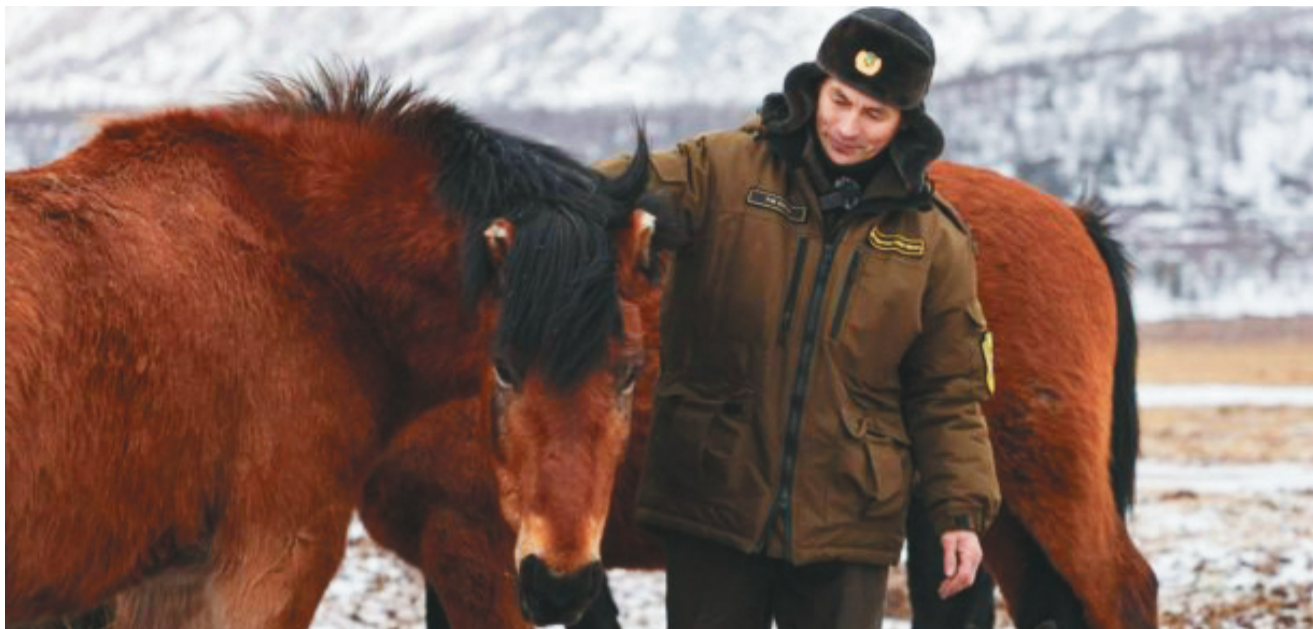
Лазарь Михайлович рупатайл шеңк самаңа тайдалды.

Хащам лапатан аматты айкедан ёхатсаюв. АНО «Ямал-Медиа» хоңа рупитты ху Андрей Швецов «Новая реальность» мир доват манам касапсайн «Говорящий с природой» верам кинайл пидан олаң тахая этас. Рупатайл «Человек и природа» номинацияйн волаң мойлапса шитас.