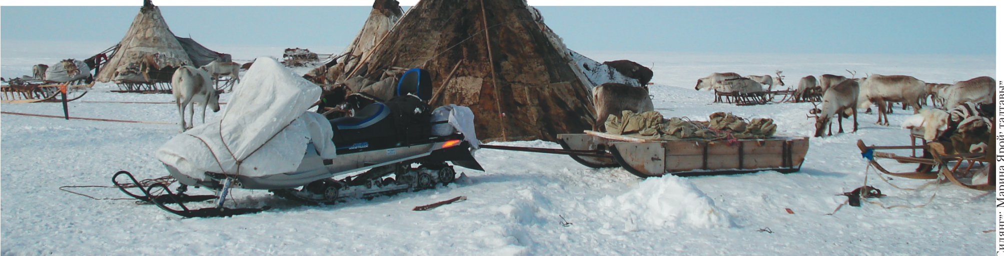
Сидяңг": Марина Ярой' тадгавы"