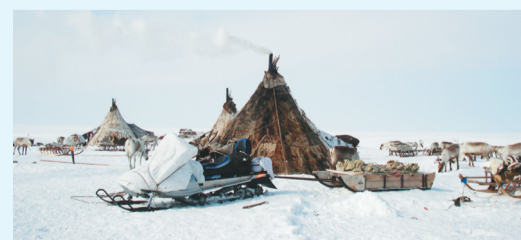
Сидяңг: Марина Яр' тадтавы

Нумда нарэйман' ненэця" маймби". Неноховавна нюсавэй" яхадейдо' пили" манне". Һацекы" һэбто' таңгм' ни" хомбю", һамгэхэвавна нядаңгурһа".