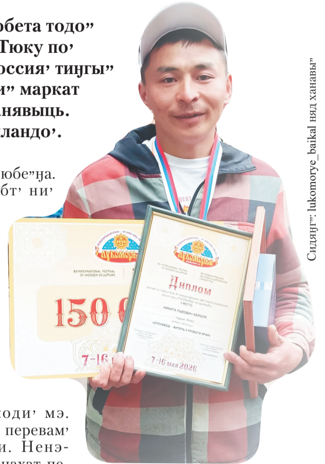
Сидяңгы: lukomorye_baikal_няд ханавы'

– Есьте'мяхат сертавы' тэкоцяхат пэйваць, нэка тарцям' мивэдем' нэңгудм'. Хусувэй мядэхэна хаюрцеты'. Нэни похона мядэхэнд хандан, тикыд ма'ламбаңгун. Ханаконцид янамбовна нэб' нэармданэңгу'. Пэвдью' ханакуд пуна