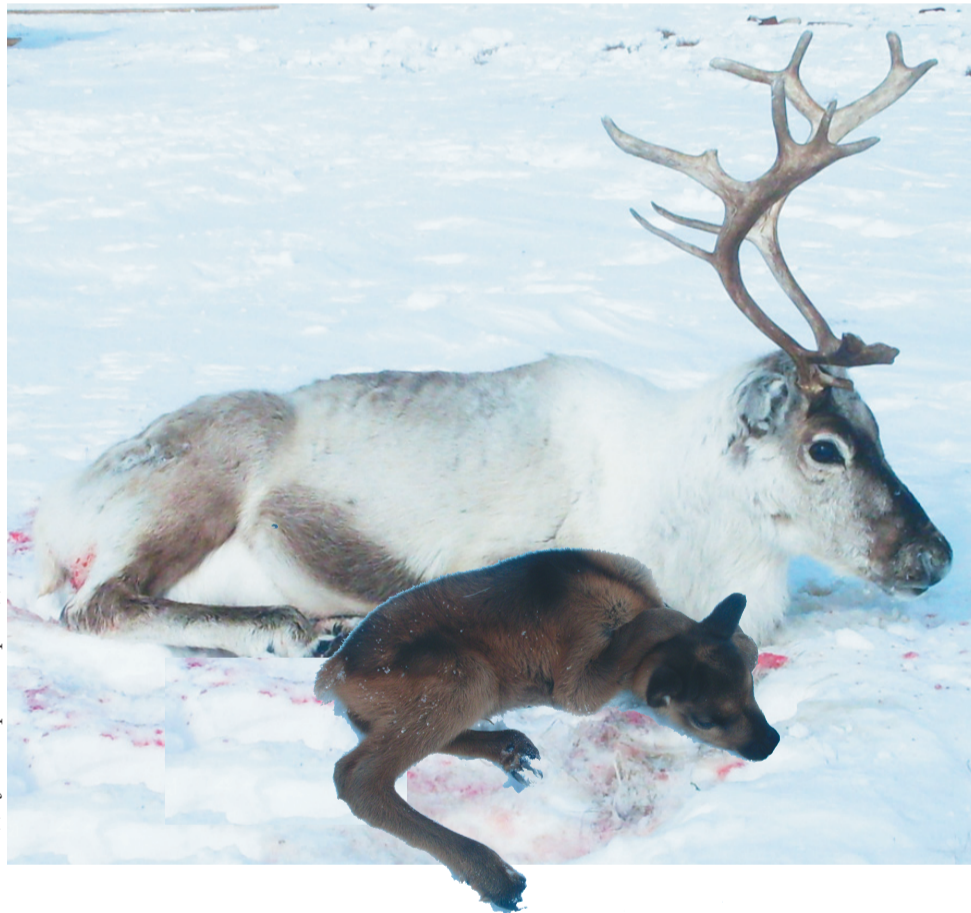
Сидяңг": Марина Яр' тадгавы"

Нумда нарэйман' ненэця" маймби". Хой' няна мэна" нина" манзаядо' саць жока. Ты пэртя" жоб" еңган' тэхэтато' ни" ханас". Неноховавна нюсавэй" яхадейдо' пили" мание". Нохо", сармик", тэня", варк" нэдакы", нюдяко суюм' саңо' вэңгона ханаңгудо'. Жацеку" нэбто' таңгм' ни" хомбю", ёамгэхэвавна нядаңгуржа".