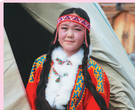
Сидяңг: Марина Яр' тадтавы

Российская Федерация Ямало-Ненецкий автономный округ