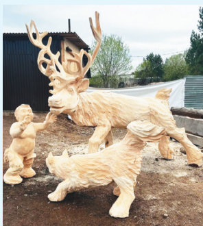
Сидяңг: lukomorie_baikal няд ханаы

Савватеевка хардахана «Лукоморье»м' нубета тодо" яхат һэда мел" ненэцие" пирдырма һась. Тюку по' юкад вата нябимдей' мэва ма"люрһаць.