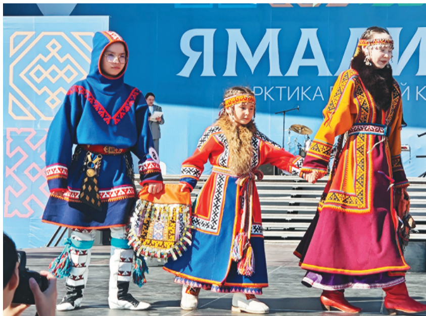
Сидя яляхана манэ"мэва", намдвэва" џока, хомбавэва" ненэця"ма" џани тамбир". Хусувэндэ' нямна сава тенебџона нянда" ваде"мана е"эмня ихина" пэйнаць.