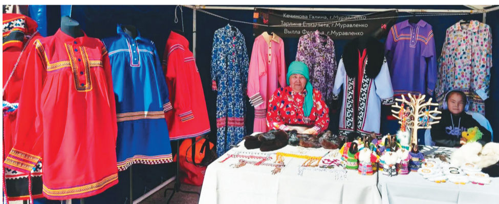
Касапсая тутдыйм пормаслад.