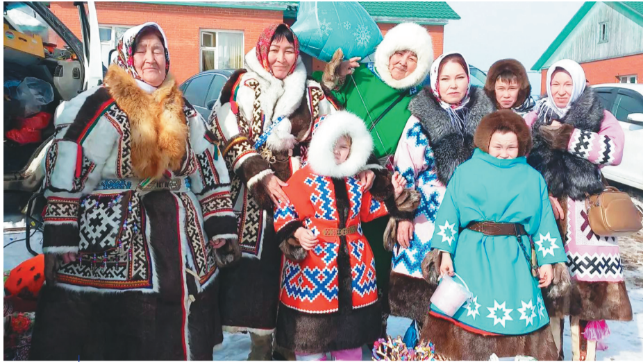
Хотгәд хоятлад пидан.