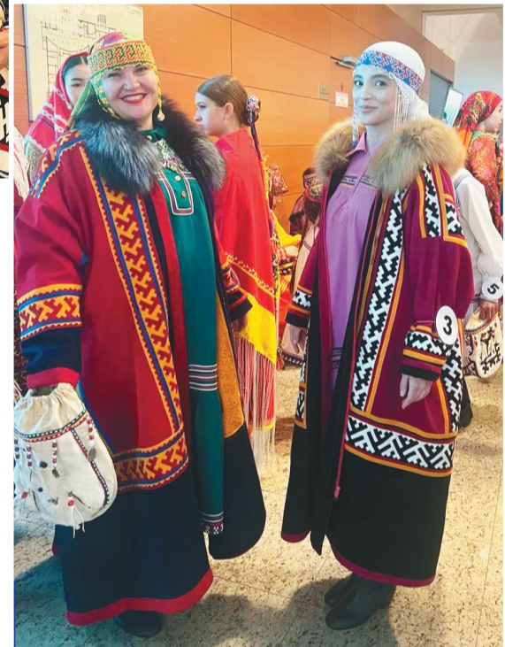
Ёнтөм сохлада луматтам нәңәд.