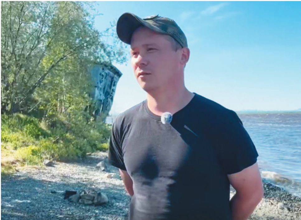
Хор: АНО «Ямал-Медиа»

Ши веран Алексей каматса ясаң ястас: «Номас понтсам там куртэван улты худ велпаслаты ёхлува нётты. Мосал ун пу-маципа ястаты Никон Николаевича Куйбина, ванты лув катра порайн тамац рупата хар пуншас. Ин манэма мосал там вер туңа-щира елды туты. Худ велпаслаты муң хошлув. Туп елды тыныты ищи хошты мосал. Ши веран ма ялап юшат каншдам, холта мощатам худэв туты верытлэв, хоя тыныты. Щит элты худ велпаслаты мохилам щеп ох дойд. Ши тумпийн ялап хопат, холпат, лупат, мотурат па па хорпи