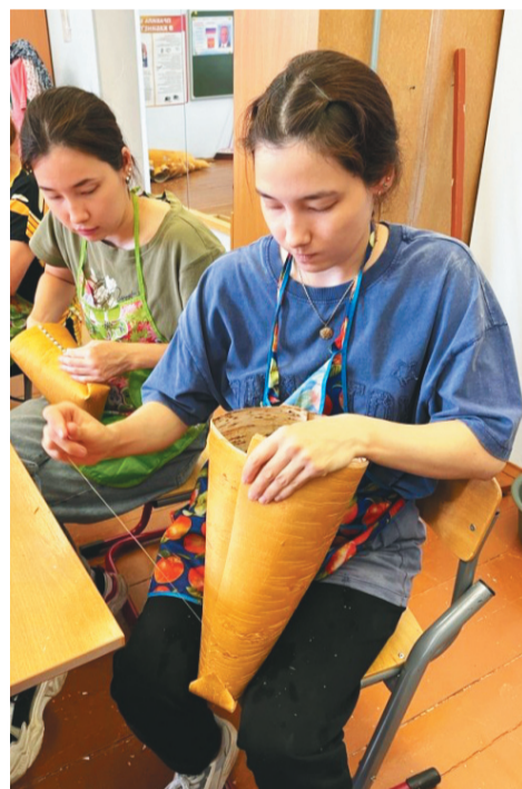
Арсыр шоши мир касапсэти каслат па нох питлат.