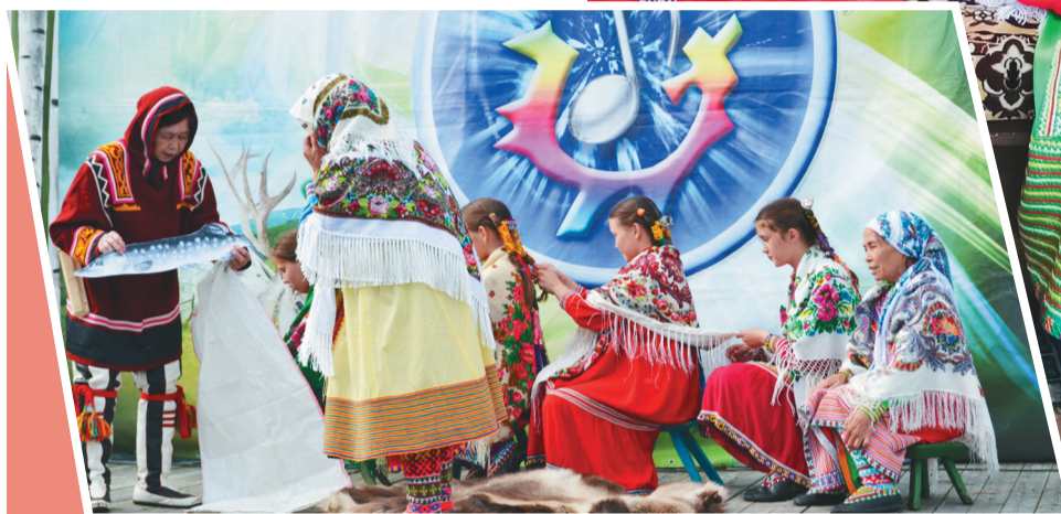
Куртац имет пилн «Ас нэ» па няврэмаң «Ай Ас ёх» ансамбльңан версат.