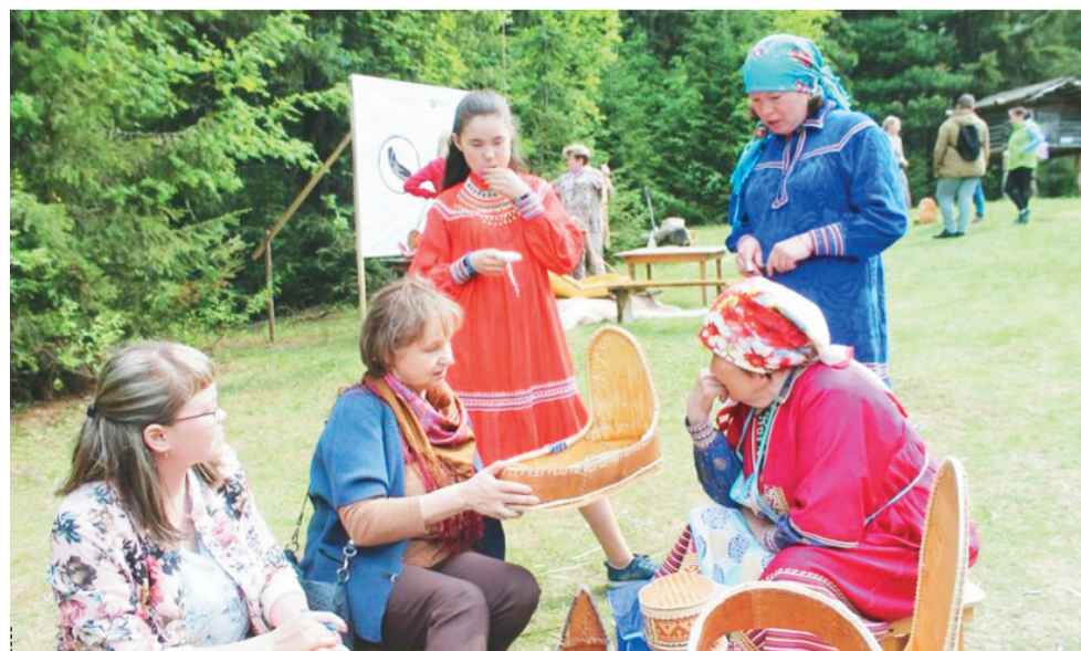
Дув тонты элды арсыр хорамаң пормасат верты уталтал.