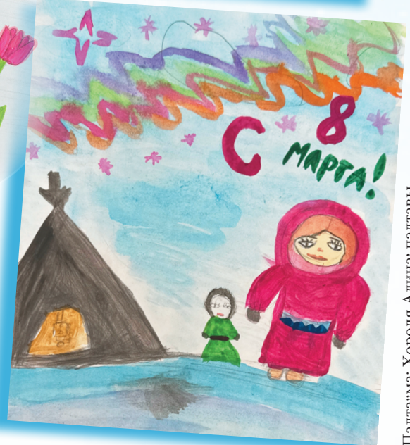
Падта"ма: Хороля Алина' падтавы