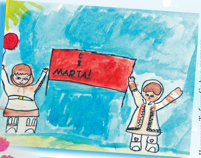
Падта"ма: Тибичи София' падтавы