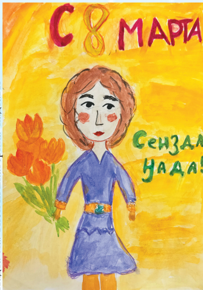
Падга”ма: Тибичи Екатерина’ падгавы

Пэвсюмя’ няна хэвхананда ҕамдёсетыдм’. Мякнани’ манзаини’ серта”махадани’ ҕобкана кино маниесетыни’. Ныланава’ яляхана лескадми сертасеты. Тикыда ёльце ҕавыдоцеты”. Леска” ҕабтпихид сосеты. Мяни хэвхана ядэр”мы ҕэб”ни, минхани намдасетыв, паромба мякни тюсетыдм’, ҕобкана сянзетыни’.