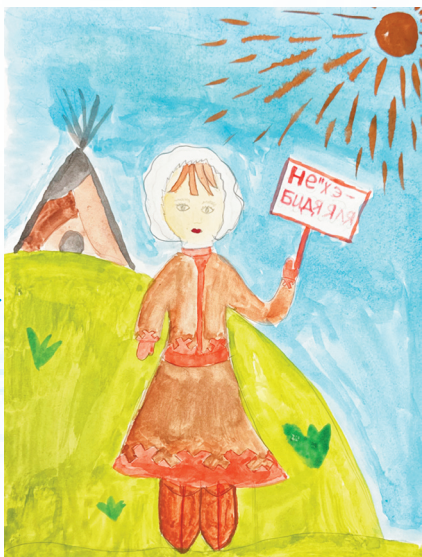
Падга”ма: Салиндер Александр’ падгавы

иле”. Илма” ҕарханда няданда перена’ то”олха. Небями хусувэй ҕамгэм’ тенева: тум’ пятаңгу, ҕаврадва” пиреңгу, пивадава”, мальцядва” сэдаңгу. Тарем’ манзараванда мальҕгана мань хэвхананда мэсетыдм’. Ханяҕэхэна нядабасетыв. Нянда сыр”мани сер’ ҕухукони” панэд сэдыбасетыдм’. Си”ми табедамбасеты: «Сэдорабат, нён паромбю”».