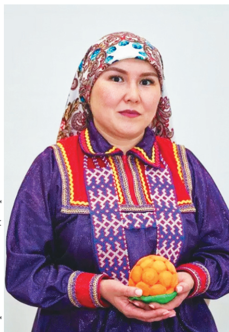
Хор: ЯНАО КМНС департамент