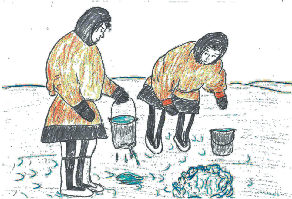
Падта"ма": Руфина Окоґэґто' падтавы"

Їэва тырцуре"э мят' ни мятю". Няґоте"э салґяна не' хэвувна ядэсумби, сидя няюд вэдепида, пуна ма: