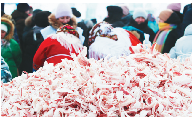
Сидяңг: Марина Яр’ гадтавы

Салабанда ханима’ нерня округна” тиңгывна сяҗок халям’ ватавамдо’ тасламбиць. Ёртя” манзаядо’ план’ җокдахад пере. Җадьбято’ ненээциена” по’ сидя вэчна етри’ варемдо’ мэ”җа”.