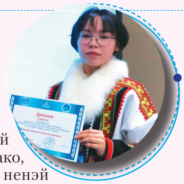
Сидяҗг: Руфина Окоэтто' тадабтавы

Ненэсянда вадёдана" җацеки" поҗгана нерня' җэдидо', то-холко ва"лэйдо' таня". Нидо' няндэ' сыраць җани' варемдо' мэта". Тарця" няхато' енаҗгу".