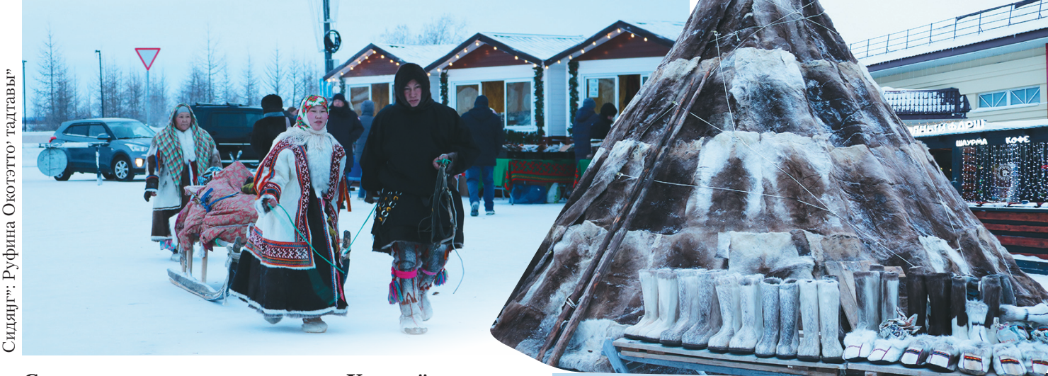
Сидярг': Руфина Окогэтто' тадтавы"

Салыңгардахана ярмарка миңась. Хусувэй по' нарка пэвдей ирыхына марад' ядэлаваха"на нэсеты. Тюку по' «Дары Ямала» нюбета рынок' хэвхана сертавэ-донзь.