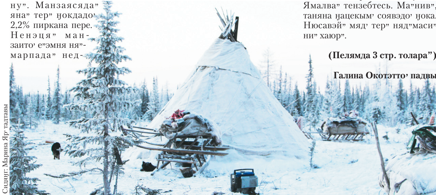
Сидяңг: Марина Яр' тадгавы

бидо' 4,5% ёльцянд' нэрмы". Тадри' навар", ила' няю' мэта" навори" ёани' мирерта". Яна" серо ня"амбада" тикым' янга маниеңгудо'. Ненэцие" илам' савумдамбава' няю' тидхалёда